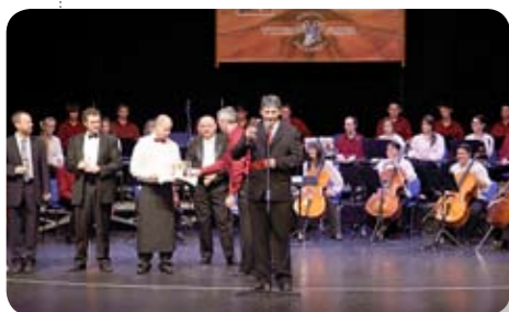
Nagsikerű koncertet adtak a kerületi növendékek