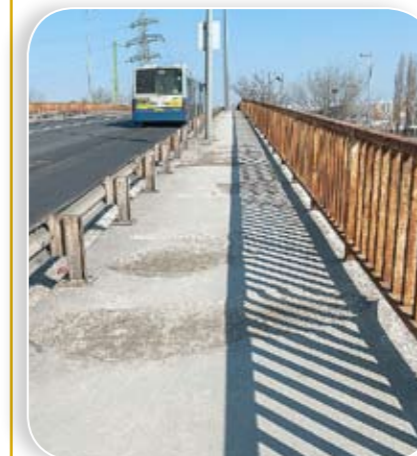
A köztúttól dupla soros szalagkorláttal elválasztott gyalog-kerékpár út épül

A felújítási munkálatok – a közúti forgalom folyamatos fenntartása mellett – két ütemben történnek majd. Az első ütemben a híd hossz tengelyben történő kettévágása után a Ferihegy felőli (keleti) oldala lesz elbontva. Ez idő alatt a forgalom a centrum felőli (nyugati) oldalra kétszer egy sávban halad. A második ütemben a centrum felőli részt bontják el, így a forgalom a megújult hídfélen haladhat kétszer egy sávban.