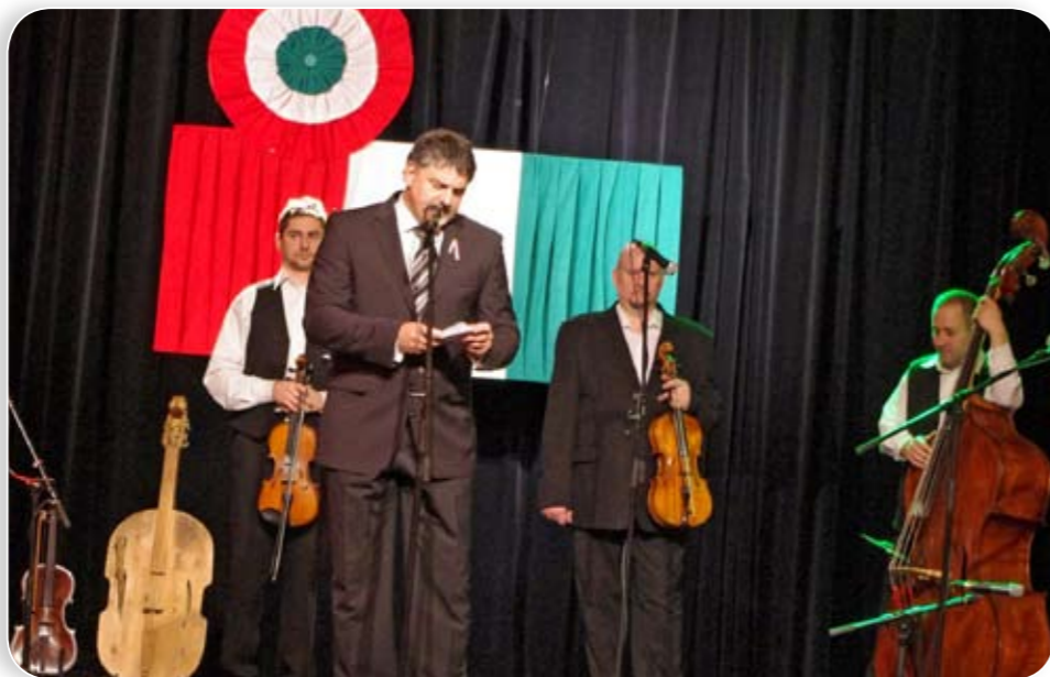
„...bármely nemzetközi közösség részévé is váljunk, az nem jelentheti a múltunkat és elveinket feladó beilleszkedést!”