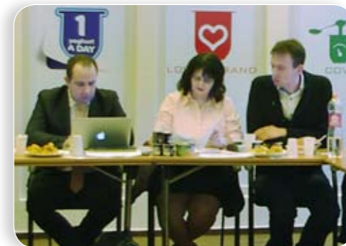
A Danone-találkozó eredménye: közös biogáz-hasznosítási lehetőség

– A következő állomás a Dreher Sörgyárak volt. Elismeréssel emelem ki a főzőházat,