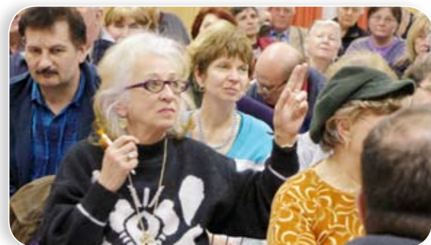
A lépcsőházi kamerák kiépítését jelentős összeggel támogatja az önkormányzat

Az érdeklődők egy része a közbiztonság javításáért emelt szót: beszámoltak például az örömlányok beljebb húzódásával együtt megjelenő „kigyúrt, kétes elemekről” is. A polgármester a lépcsőházi kamerák felszerelését javasolta – ezt pályázati pénzzel is támogatja a Kőbányai Önkormányzat –, illetve azt, hogy a lakók mindig zárják a házak bejárati ajtóit. Ezt a városrészt egyébként hónapokon belül felszerelik térfigyelő kamerákkal, és ettől a technikai segítségtől jelentős javulást várnak a közbiztonsági szakemberek.