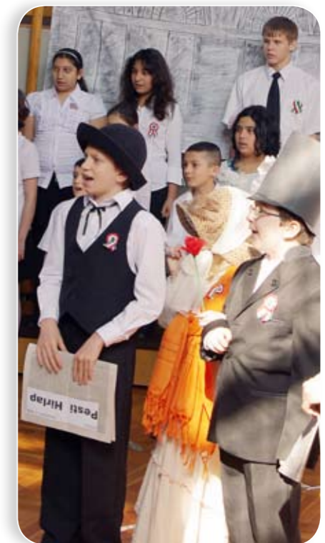
A különböző fogyatékkal élő gyerekek és a pedagógusok hónapok óta készültek a közös ünnepre

Dr. György István főpolgármester-helyettes 23 éve rendszeres látogatója a komplex iskolának, ám mindig különleges érzéssel lép a falak közé. Mint mondta, nem lehet belépni ide más-ként, csak pőrére vetkőzött, tisztá lélekkel. Itt ugyanis minden pillanat az önzetlen, alázatos törődésről és a kölcsönös szeretetről szól. Az ugyancsak a kezdetektől rendszeres látogató Révész Máriausz képviselő pedig azt említette, hogy Kőbányának is büszkesége ez az intézmény, az itt dolgozó pedagógusok, az igazgató munkája és az iskola jó példája annak, hogy miként lehet jóakarattal, kreativitással és odaadással csodát teremteni nehéz körülmények között is.