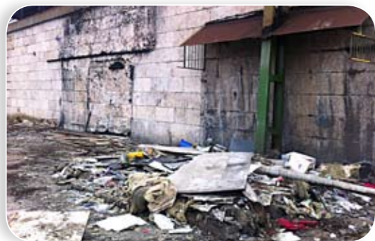
Katasztrófa sújtotta terület... vagy csak a MÁV-osok „takarítottak”?

„Több levélváltást követően legutóbb 2012 októberében fordultam Önhöz írásban, intézkedését kérve a Budapest X. kerület, Kőbányai út (Mázsa tér) 38925/3 helyrajzi számú ingatlanon található két pavilon elbontása, illetve a Kőbánya alsó vasútállomás környezetének rendezése ügyében. Levelemre a mai napig nem kaptam választ, sajnós intézkedést igen. A kért bontás ugyanis megtörtént, oly módon, hogy sikerült az eddig is mindenki megdöbbenését kiváltó állapotokat tovább fokozni. Soraimnak nyomatékot adva – és prezentálva azt a képet, amely a Budapest mértani középpontjában fekvő kerületünk kapuját és Budapest egyik legforgalmasabb közlekedési csomópontját jellemzi – mellékelem az aktuális állapotokról készült fényképet.”