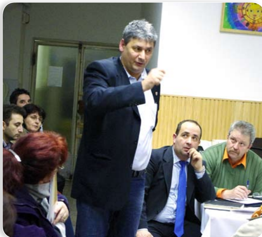
Felvetődött: több közterületrészt senki sem takarít. A polgármester „takarítási térképet” készített