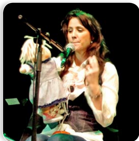
Friss, teljes kiőrlésű biomesse sok zenével, Dinnye úrral, tréfarépaevessel és spenót kerékpárral...