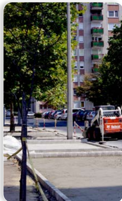
1600 férőhelyes lesz a fizetős parkoló

Iroda ügyfélszolgálatán. A polgármester kiemelte, az új parkolási rendszer elsődleges célja, hogy megoldja a Gyakorló utcai lakótelep lakosságának régóta húzódó közlekedési és parkolási problémáját, valamint hogy lakókörnyezetüket rendezetté, élhetővé tegye.