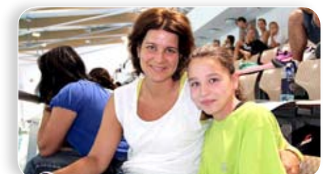
A fiatal tehetség példaképének tekinti Egerszegi Krisztinát