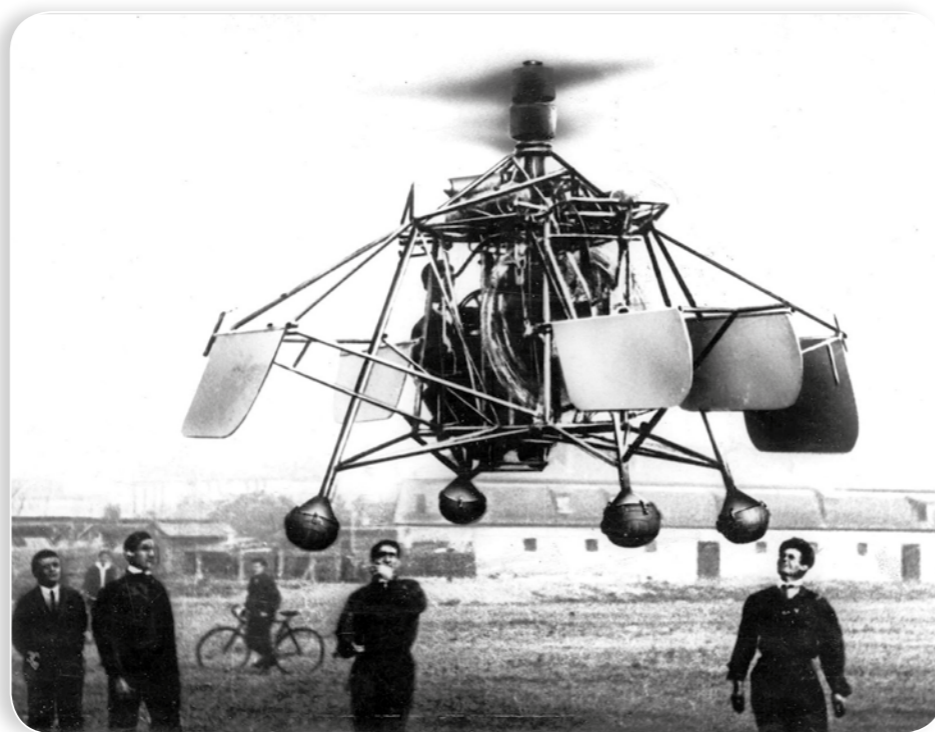
Asbóth Oszkár kísérleti gépe