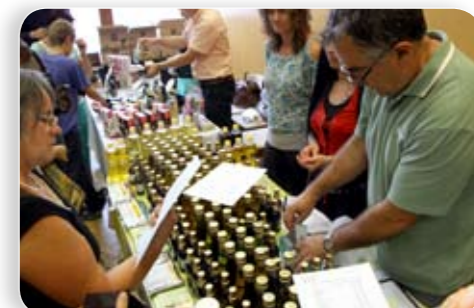
A Vegetáriánus napon a legkülönfélébb ételeket és fűszereket lehetett megkóstolni