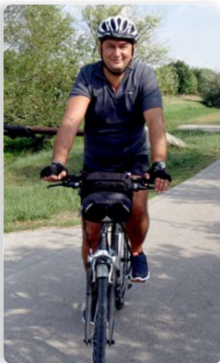
Ha van egy kis szabadidőm, szívesen kerékpározom

Nem csak „kerítéseken belül” fejlődött kerületünk a nyáron. Otthonunk egyik különleges pontja, az Újhegyi Mély-tó környezete is megszépült, és az eddig kissé elhanyagolt Téglamúzeum szintén teljesen új arculatot kapott. Öröm látni, hogy a korábrinál sokkal rendezettebb környezetet miként fedezik fel a környékbeli, miként veszik birtokba a különleges új padokat egy kis pihenésre a gyermekükkel sétáló kismamák. Ez a legnagyobb elismerés! Azért halkan megsúgom Önöknek, hogy idén