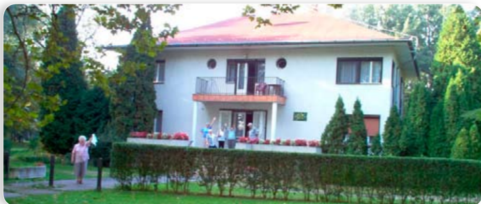
A korábbi évekhez hasonlóan idén is több mint százán üdülhetnek az önkormányzat támogatásával