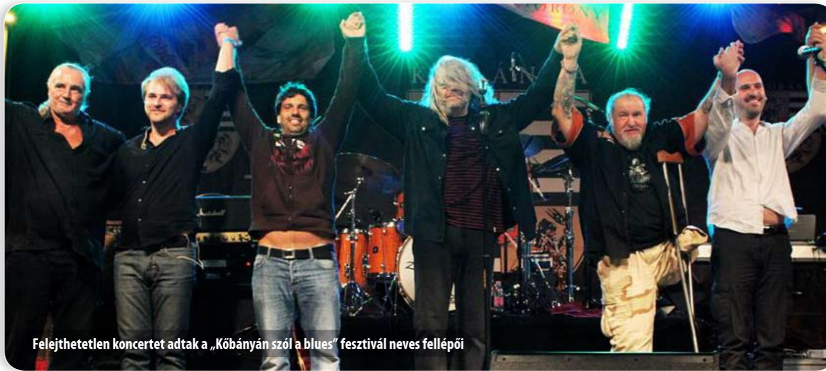
Felejthetetlen koncertet adtak a „Kőbányán szól a blues” fesztivál neves fellépői