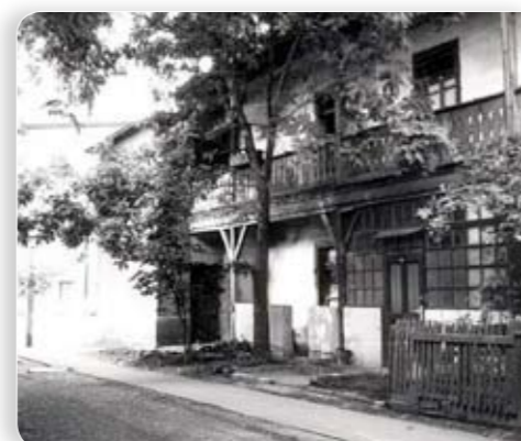
Ceglédi út 40/B