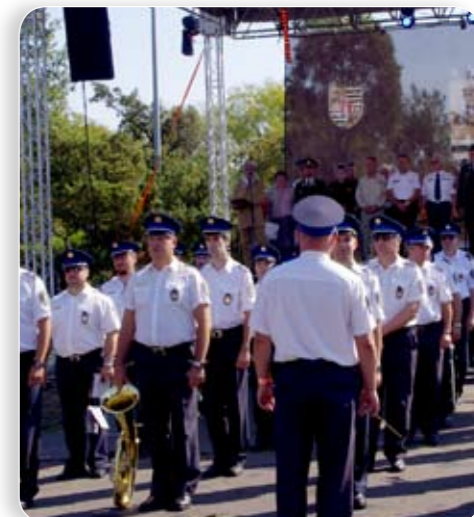
A Készenléti Rendőrség fújt ébresztőt

A hagyományteremtő bluesfesztiválról a következő oldalon olvashatnak.