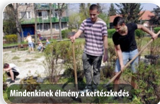
Mindenkinek élmény a kertészkedés

A „Virágos Kőbánya” közterületi virágültetési akció keretében pedig egynyári virágok kiültetésében vehetnek részt a környezetükre adó kőbányai lakók. A tervek szerint a következő helyeken szerveznek virágültetést – ugyancsak a Kőkert szakmai és eszköztámogatásával: Állomás utca; Körösi Csoma sétány; Kőr utca, középső, zöld sáv; vadasparkbejárat; Körösi Csoma sétány (kopjafánál); Polgármesteri Hivatal előtti fakockák; Gutor tér; Balkán utca; Mádi utca-Zsombék utca sarok; Újhegyi sétány több szakaszánál (kenyérboltnál, óvodalepcsőnél, óvoda előtt, Harmat utcai lépcsőnél); Hang utca; Mádi utca-Gitár utca, körforgalom; Csósztorony, körforgalom; Pongrác úti orvosi rendelő (növénykazetták és ágyások). Az ültetések pontos időpontjáról és a találkozó helyszíneiről a Kőkert ingyenes zöldszámán (06-80-565-378) és a honlapján (kokertkft.hu) ad tájékoztatást, valamint az elültetett virágok utógondozását is elvégzi. A növényeket is a Kőkert biztosítja.