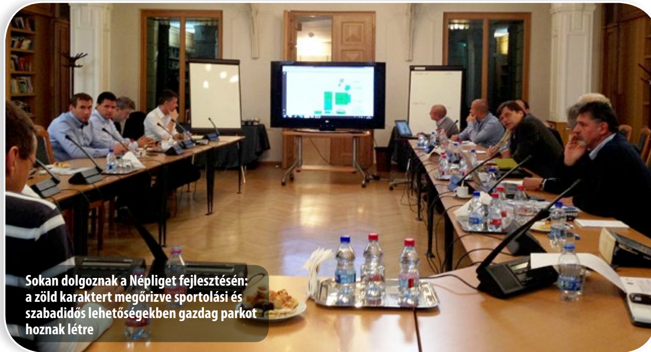
Sokan dolgoznak a Népliget fejlesztésén: a zöld karaktert megőrizve sportolási és szabadidős lehetőségekben gazdag parkot hoznak létre

A sok lakossági panaszt okozó, immár felszámolásra került Zágrábi utcai szelektív hulladékgyűjtő sziget helyén alacsony, egész nyáron virágzó parkrózsákat ültethetnek – a Kőkert munkatársainak segítségével és utógondozása mellett.