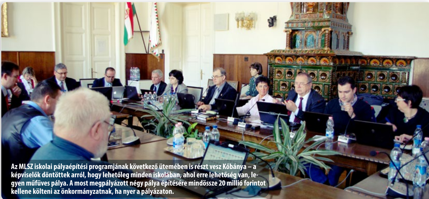
Az MLSZ iskolai pályázat programjának következő ütemében is részt vesz Kőbánya – a képviselők döntöttek arról, hogy lehetőleg minden iskolában, ahol erre lehetőség van, legyen műfüves pálya. A most megpályázott négy pálya építésére mindössze 20 millió forintot kellene költeni az önkormányzatnak, ha nyer a pályázaton.