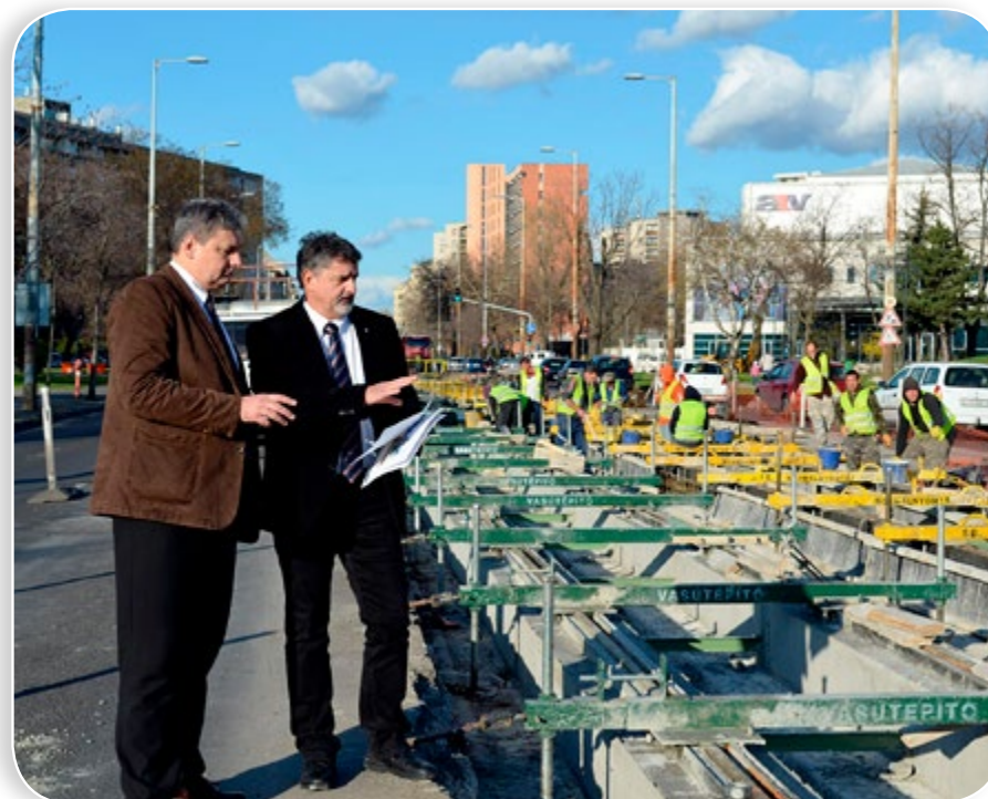
A 3-as vonalát teljesen újjáépítik, korszerű, alacsony padlós villamosok suhannak majd a füvesített pályán