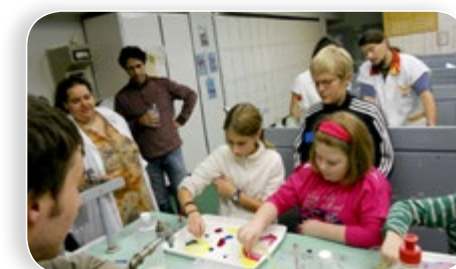
Minden korosztálynak új információkat és élményeket hoznak a nyílt napok