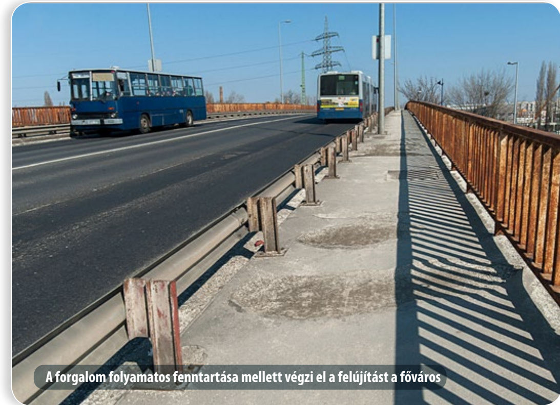
A forgalom folyamatos fenntartása mellett végzi el a felújítást a főváros

zásánál a buszmegállóhoz tartozó gyalogátkelőhely. A mostani munka ezt a hiányzó kapcsolatot pótolja. A Keresztúri út 132. számnál – a díszítőüzemnél – a kialakítandó zebrával a Keresztúri út két oldalán, egymással szemben található buszmegállók között létesül biztonságos gyalogoskapcsolat. Az átkelőhely kialakítása megkezdődött, és rövid időn belül át is adják a zebrákat a gyalogosoknak. (Kőbányán kívül Pestszentlőrincen és Rákosmentén találkozhatnak az autósok és gyalogosok a most folyó munkák eredményével, vagyis új gyalogátkelőhelyekkel.)