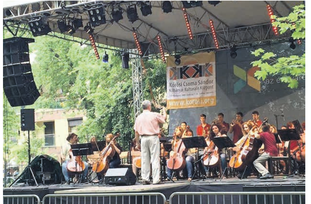
A Tutta Forza Zenekarhoz később a csehországi Letovicéből érkezett fúvósok csatlakoztak

Az idei kitüntetettek teljes listáját külön kiadvány tartalmazza, amely bemutatja az elismeréseket és díjazottakat is. A kiadványt keresse a Kőrösi Kulturális Központban vagy töltsse le a kobanya.hu önkormányzati honlapról.