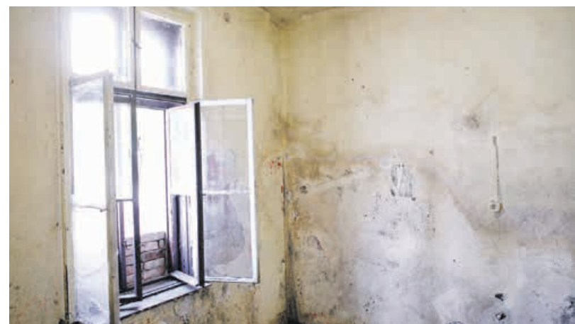
Ez maradt a 11 tagú család egykori otthonából