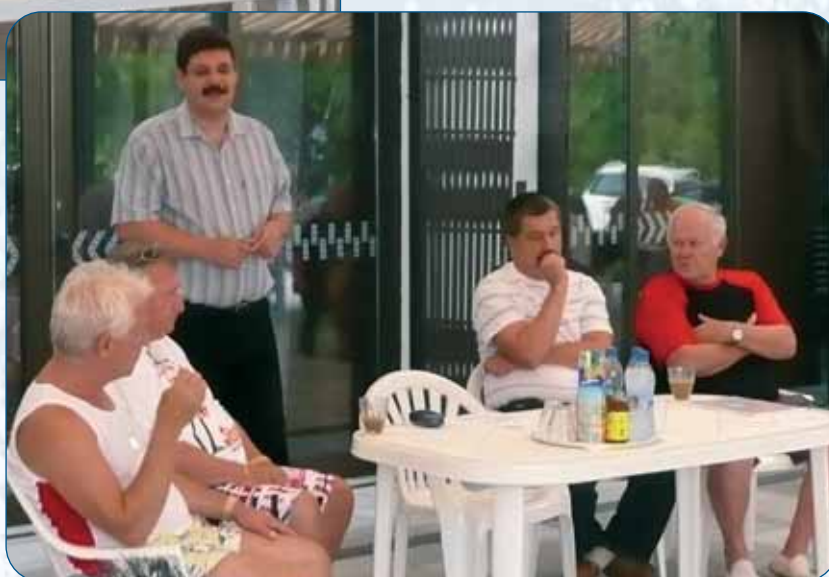
Sport fórum Verbai Lajos polgármester úrral.