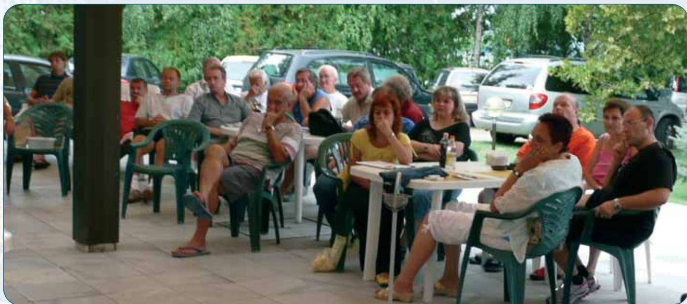
Előadások a sportvezetői továbbképzésen.