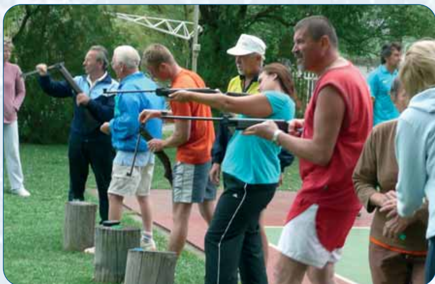
Sportversenyek a továbbképzésen.