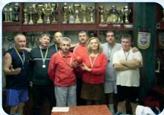
Teke válogatottunk: Kőbányai Aranykezüek néven szerepel a bajnokságokban.