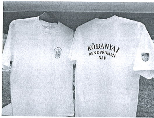
Pólók rendvédelmi napra