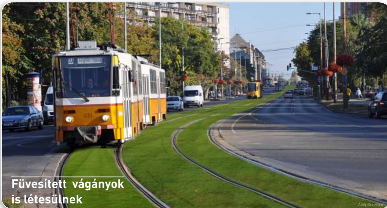
Füvesített vágányok is létesülnek