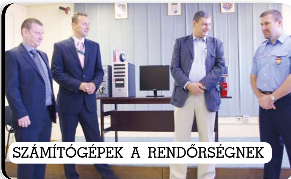
SZÁMÍTÓGÉPEK A RENDŐRSÉGNEK

10 új számítógép konfigurációt kapott a kerületi rendőrkapitányság a Kőbányán működő Docler Holding informatikai cégcsoporttól. Az ünnepélyes átadásra október 13-án került sor.