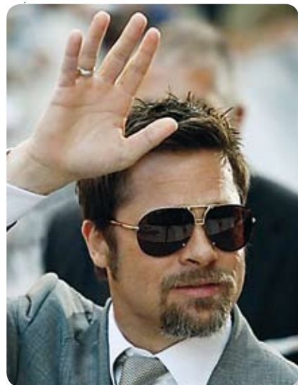
Hollywoodi sztárok a kerületben