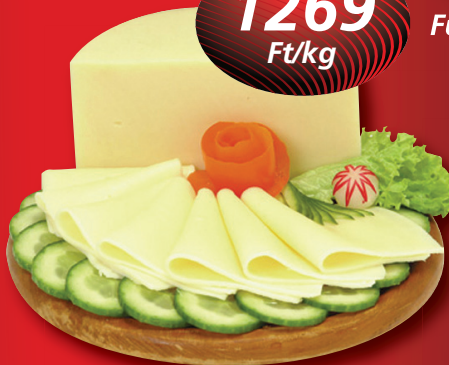
Hajdúsági kerek trappista