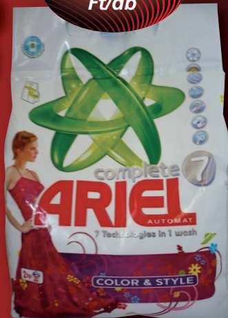
Ariel mosópor Mountain Spring, Color 2 kg, 835 Ft/kg