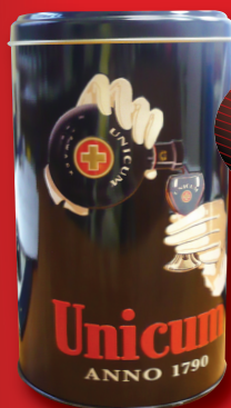
Unicum 40% diszdobozban 0,5 l, 4278 Ft/l

Vásároljon a gazdaságos, családi MAGYAR üzletekben!