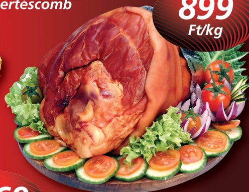
Füstölt hátsó csülök