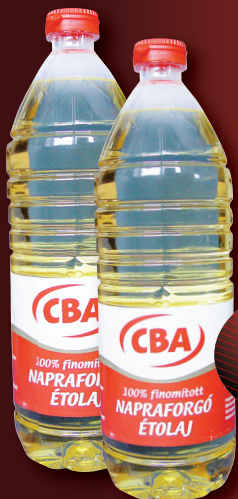
CBA Napraforgó étolaj 1 l