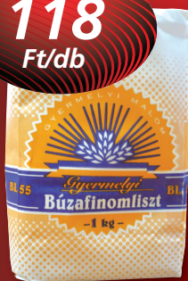
Gyermelyi Búzafinomliszt 1 kg