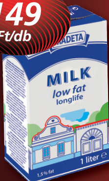
Madeta UHT tej 1,5%, 1 l