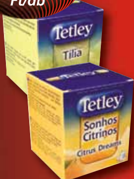
Tetley tea többféle íz 10 x 1,5–1,6 g