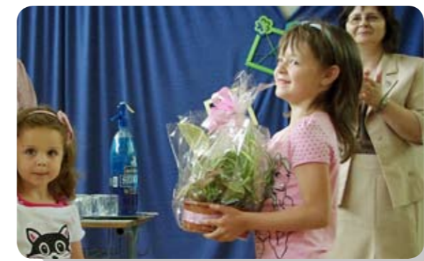
Az alkotók öröme. A nyertesek ajándécsomagot is kaptak

szemben, azaz allergiás. Ami a parlagfűvet illeti, róla mindenképpen érdemes elmondani, hogy a pollenjére érzékenyeknek a táplálkozásukra is különösen oda kell figyelni a nyári, őszi időszakokban. A keresztallergia ugyanis nagyon sokak életét teheti tönkre, okozhat veszélyhelyzetet. Ennek a lényege, hogy a parlagfű pollenjére hasonlítanak bizonyos gyümölcsök fehérjei – pontosabban a szervezet hasonlóan reagál rájuk. Ez azt jelenti, hogy a parlagfűre érzékeny emberek – fertőzésveszély idején – nem ehetnek görögdinnyét, sárgadinnyét, cukkinit, uborkát, banánt és mákot sem, mert ezek fogyasztása ugyanolyan tüneteket válthat ki, mintha egy parlagfűvel benőtt réten sétálgatnának.