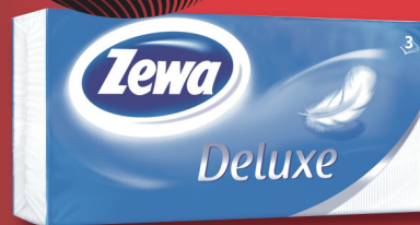
Zewa DuLuxe papír zsebkendő többféle, 90 db-os