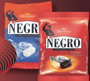
Negro keménycukorka többféle 79 g, 2266 Ft/kg