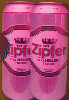
Zipfer dobozos sör 0,5 l, 578 Ft/l