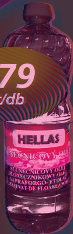
Hellas étolaj 1 l