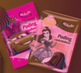
Dolcela Pudingpor vaníliás, csokoládés, 40-43 g