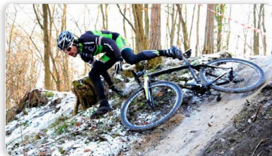
Két körrel a vége előtt... A bajnok szerencséjére a riválisa is hibázott