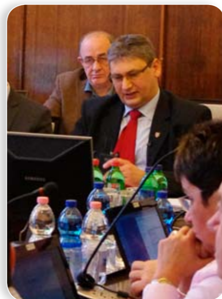
A tanulmányok és a 100 ezres határt meghaladó szerződések nyilvánosak

ségeket okoz a bérlakások fenntartása, akkor miért szociális alapon ad lakást az önkormányzat, miért nem közelít jobban a piaci árviszonyokhoz. Weeber Tibor alpolgármester elmondta, hogy a lakások állapota okozza a veszteséget, nem pedig a szociális megfontolások. Bizonyos leromlott állapotú lakásokért nem lehet többet kérni, mint amennyit most kér az önkormányzat.