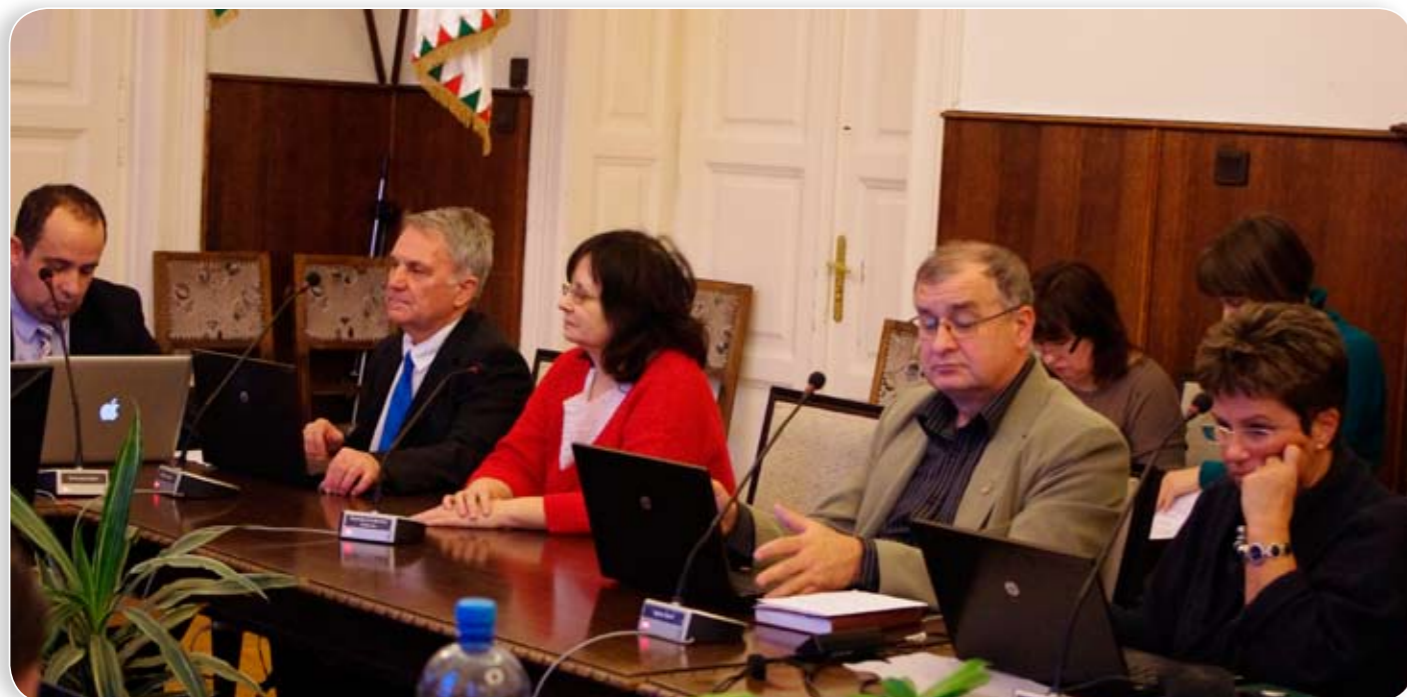
Ismét ellenzéki javaslatokat, illetve módosító javaslatokat fogadott be a testület, a bérlakás-konceptió pedig minden képviselő elismerését kivívta