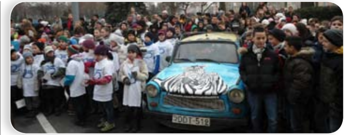
Hatalmas gyereksereg búcsúztatta az afrikai jelmezbe öltözött Trabantokat

Pérez számolva, könyv olvasva jó! Az olvasó pedig díjazva a legjobb! Pontosabban a legjobb olvasó díjazva jó, ám ennek érdekében be kell iratkozni, s a korábbi tagokkal együtt olvasni, kölcsönözni, olvasni, kölcsönözni... és gyűjteni a pontokat. Ne késlekedjen! A játék január idusán ugyan elindult, ám még nem késő – kicsiny lemaradást gyorsan behoz egy jó olvasó! A Kőbánya olvasója verseny részleteit a Kőrösi Kulturális Központban, a könyvtárban megtalálják.