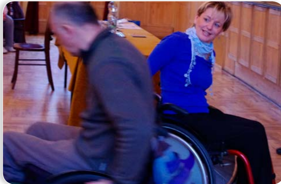
Rengeteg gyakorlás és 30 fellépés évente. A Gördülő Táncsoport óriási erőt ad a nézőknek

A Vöröskereszt által szervezett februári nyilvános véradások Kőbányán: Február 15. 12.00–19.00: Köki Terminál, 2. szint, fotósarok. Február 26. 10.00–13.00: Giorgio Perlasca Vendéglátóipari SZKI, Maglódi út 8. Február 28. 12.00–16.00: Köbe biztosító, Venyige u. 3. A regisztrációhoz személyi igazolvány, lakcímtábla és táj-kártya feltétlenül szükséges.