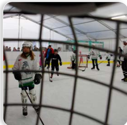
Hokisakon keresztül ilyen a világ (illusztráció)