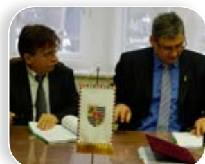
Három hónapon belül 71 kamera vigyáz a rendre

A kőbányai képviselőtestület 2009-ben döntött a biztonságot növelő kamerarendszer első ütemének felszereléséről. Egy évvel később az Újhegyi lakótelepen, a városközpontban és a Venyige utcai bv-intézetnél 37 közterületi kamerát helyeztek üzembe, amelyek figyelőszolgálatát a BRFK X. kerületi rendőrkapitányságának munkatársai látják el. A második ütemben, 2011 tavaszától újabb 16 kamera állt szolgálatba a Gyakorló utcai lakótelepen, illetve annak környékén.