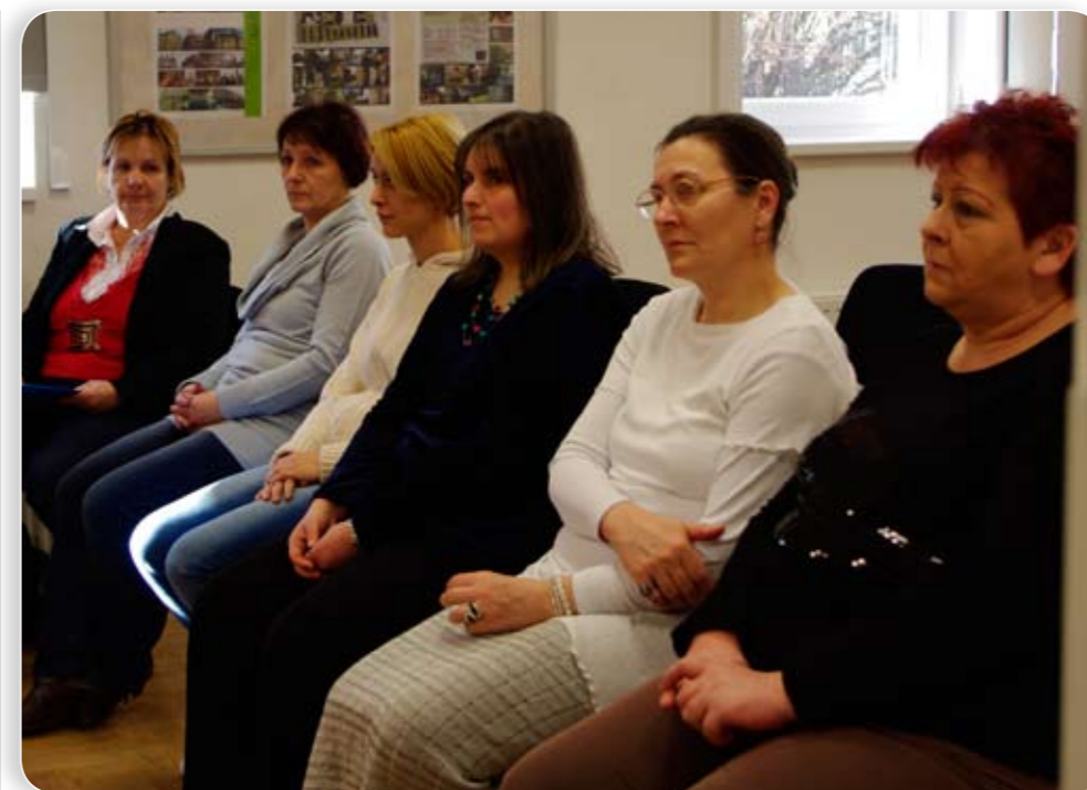
Oktatók és oktatottak. Kommunikációs, jogi, egészségügyi ismereteket és állás-keresési technikákat is tanultak a programban részt vevő nők