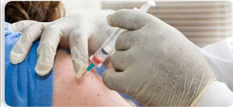
Az oltóanyagok biztonságosak, élő kórokozót nem tartalmaznak