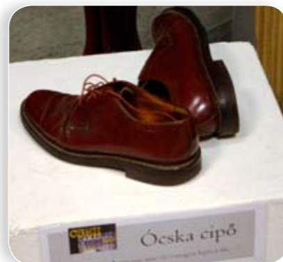
Minitárlat a relikviákból