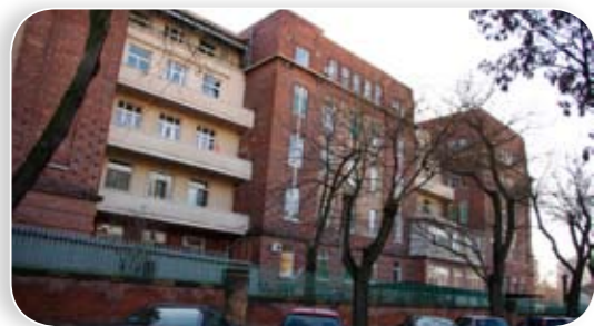
Akut- és krónikusellátás a Bajcsyban, mozgásszervi rehabilitáció a Péterfyben