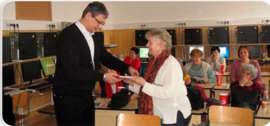
Nyolc helyszínen tanulhatták a számítógépes tudományt a szépkorúak. Itt éppen a Janikovszky Éva Általános Iskolában tanulóknak gratulálók

Kerületünk közbiztonságát érintően is újabb nagy lépést tettünk, aláírtuk a térfigyelő rendszer bővítéséről szóló szerződést, melynek keretében az Üllői út, Zágrábi út, Balkán utca és Száva utca térsége gazdagodik tizennyolc térfigyelő kamerával.