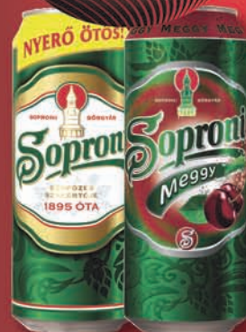
Soproni, Soproni Meggy ízesítésű dobozos sör 0,5 l, 398