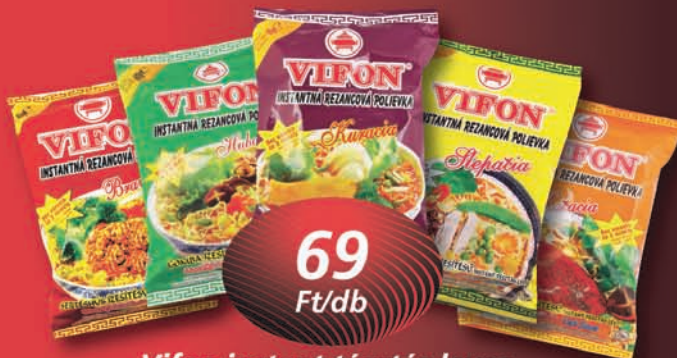
Vifon instant tésztás leves többféle, 60 g, 1150 Ft/kg