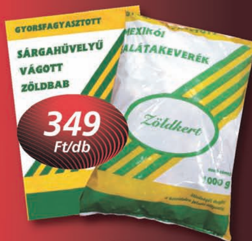
Zöldkert Sárgahüvelyű zöldbab, Mexikói Zöldségkeverék 1000 g