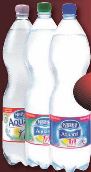
Nestlé Aquarel ásványvíz dús, enyhe, mentes, 1,5 l, 57 Ft/l