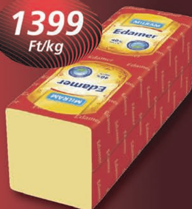
Milram edami sajt