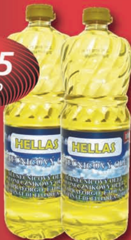
Hellas étolaj 1 l