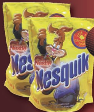
Nesquik Kakaópor 400 g, 1498 Ft/kg