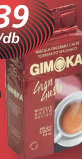
Gimoka Gran Gusto őrlött kávé 250 g, 1756 Ft/kg