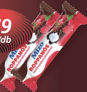
Mizo Túrós Rudi málnadarabokkal, ét, fehér bevonós 30 g