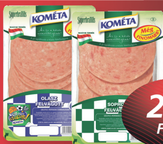
Kométa Még finomabb! Olasz, Soproni, Zala, Fokhagymás felvágott, Házi disznósajt, Harmónia párizsi szeletelt, 125 g, 1992 Ft/kg