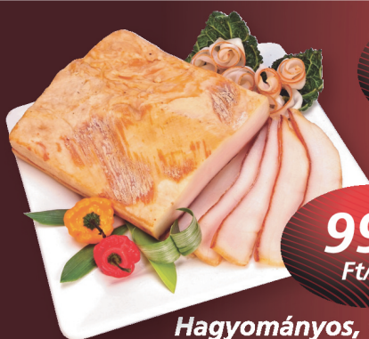
Hagyományos, füstölt csemegezalonna