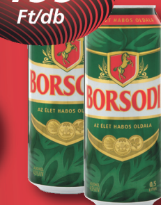
Borsodi dobozos sör 0,5 l, 398 Ft/l