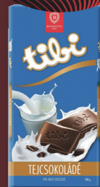
Tibi táblás csokoládé többféle, 100 g, 1690 Ft/kg