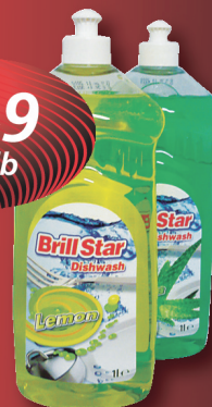
Brill Star mosogatószer Lemon, Aloe vera, 1 l