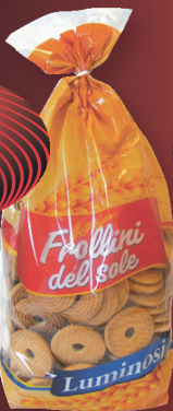
Frollini teasütemény Luminosi, Raggi di Sole 1 kg