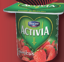
Danone Activia joghurt többféle íz, 125 g, 792 Ft/kg