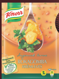
Knorr ínycsont levesek többféle, 43-80 g, 3738-6953 Ft/kg