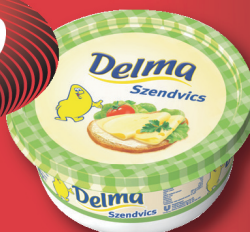
Delma Szendvics 500 g, 478 Ft/kg