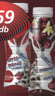
Mizo ivójoghurt eper-málna, meggy-vanília, PET, 330 ml, 512 Ft/l