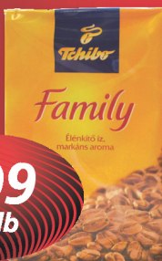
Tchibo Family őrölt kávé 250 g, 1996 Ft/kg