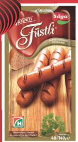
Füstli többféle íz 140 g, 1799 Ft/kg