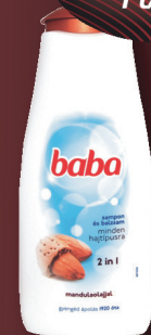
Baba sampon többféle illat, 400 ml, 1123 Ft/l