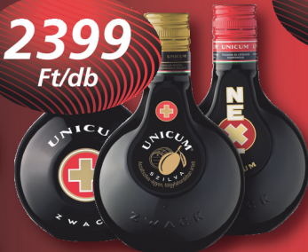
Unicum 40%, Next 30%, Szilva 0,5 l, 4798 Ft/l