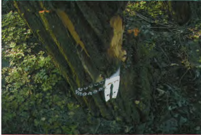
(megzavart fatolvaj mezővédő erdősávban)

42 esetben történt intézkedés, melynek közel kétharmada meghaladta a szabálysértési határt. Ezek az esetek főleg a mezővédő erdősávokban voltak tapasztalhatóak, de tetten értünk már természetvédelmi területen is fatolvajokat. Mivel az ilyen esetek bűncselekménynek számítanak ezért a legtöbb alkalommal rendőrségi intézkedésre kerül sor.