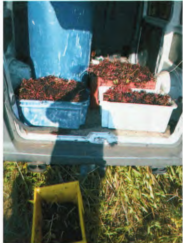
(ipari mennyiségű bodzaszedés Természetvédelmi területen)