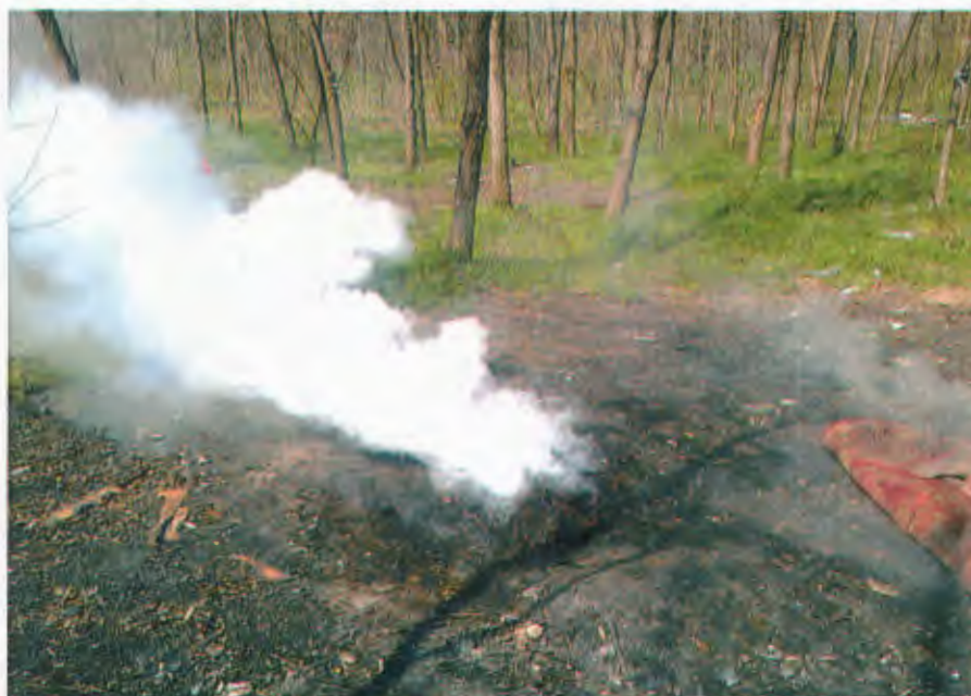
(erősen környezetkárosító tevékenység a kábelégetés)

Környezetkárosító esetek közül a legjellemzőbb a kábelégetés, mely kapcsán 25 intézkedés történt. A törvényi szabályozás alapján a 2013. évi CXL. fémtörvény alapján a hulladék átvevőhelyek már nem vehetik át az égetett kábelt ezért ez a fajta jogsértés nagyban visszaszorult.