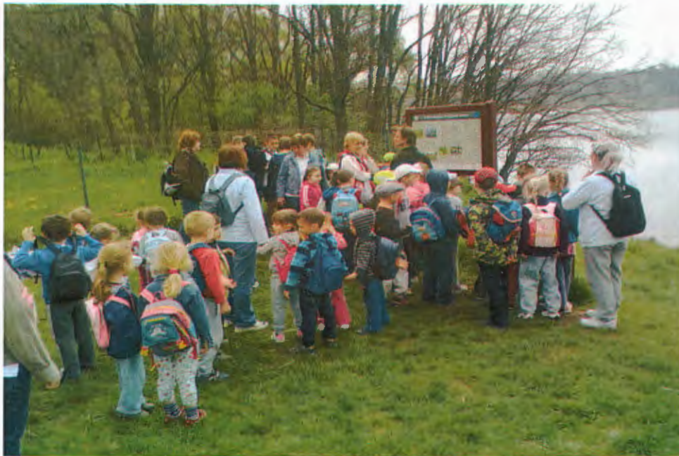
(Óvodások vezetése a Naplá-tavi tanösvénynél)

Fontosnak tartjuk a környezettudatos gondolkodás terjesztését és alkalmazását, amivel főleg a fiatal korosztályt célozzuk meg. Az őrszolgálat csatlakozott a 2011 CXCV. törvényben meghatározott Községi Szolgálati programhoz, mint fogadó intézmény. A program során számos iskola jelezte részvételi szándékát és ennek megfelelően rendszeresen jöttek diákok a 2013-as évben, hogy az intézménynél töltsék az iskolai közösségi szolgálatukat. A tavalyi év során ez 70 tanulót jelentett, ennek megfelelően közel 1225 órát igazolt az őrszolgálat a közösségi szolgálatról. Az iskolákkal minden esetben együttműködési megállapodás aláírására kerül sor, mielőtt a tanulók munkára jelentkeznek. A tevékenységük a mezőőr kollégák által irányítottak, legtöbb esetben szemétszedés, takarítás és a Naplás tavi, valamint a Merzse-mocsárnál található tanösvény karbantartása volt. Immár hagyománnyá vált az őrszolgálat által megszervezett, tavaszi és őszi