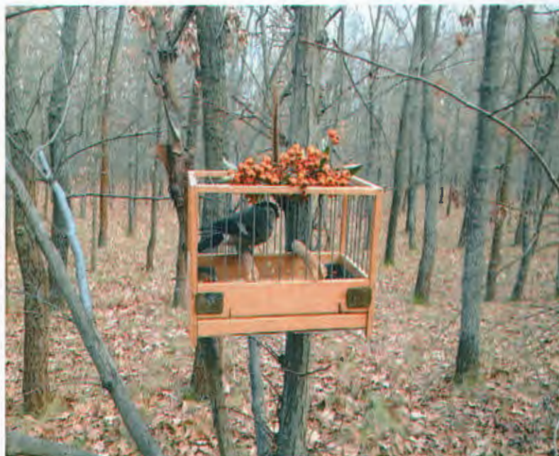
(madárháló 'munka' közben) (az énekesmadarokat 'csalimadarak' kihelyezésével fogják be)