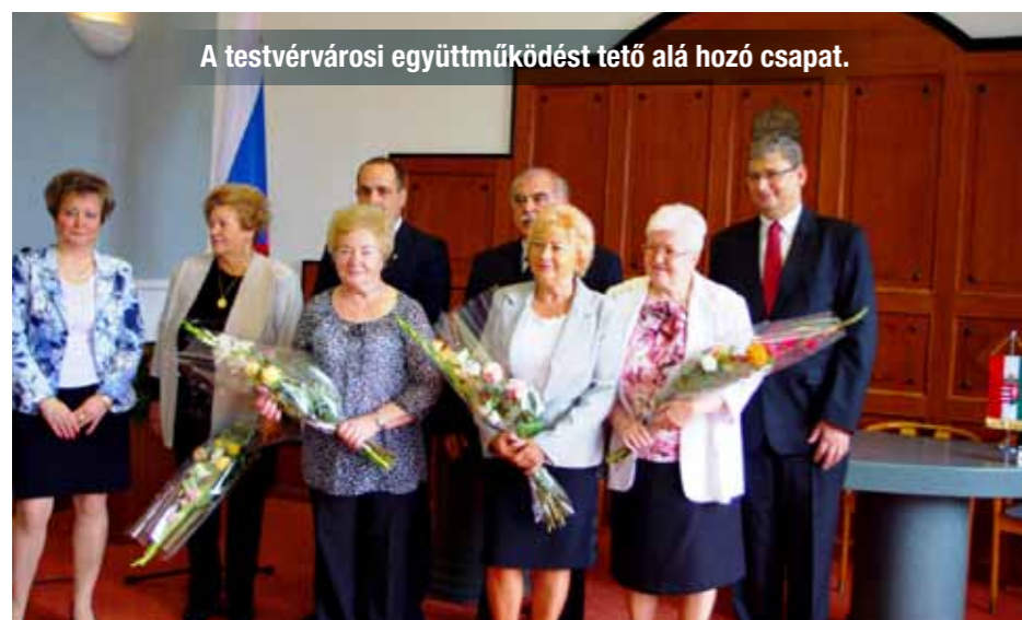
A testvérvárosi együttműködést tető alá hozó csapat.

Még szorosabbra fűztünk határon túli kapcsolatainkat: Párkány mostantól Kőbánya testvérvárosa. A kultúra, a sport és az oktatás területét is érintő együttműködési megállapodást írt alá a két város polgármestere. A nyár végén a párkányi gyerekek már táboroztak is nálunk.