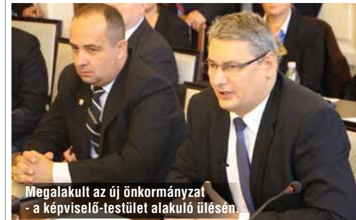
Megalakult az új önkormányzat - a képviselő-testület alakuló ülésén.

Az új önkormányzat alakuló képviselő-testületi ülését október 30-án tartottuk. A Helyi Választási Bizottság elnöke előtt lettem a polgármesteri esküt, majd a fogadalmakat követően valamennyi képviselőtársammal és bizottsági taggal együtt átvettük megbízóleveleinket.