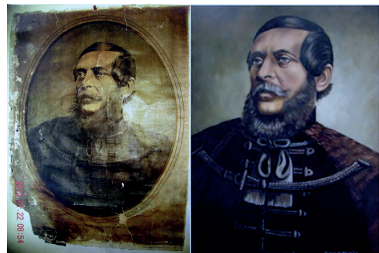
Az arckép és a róla készített másolat