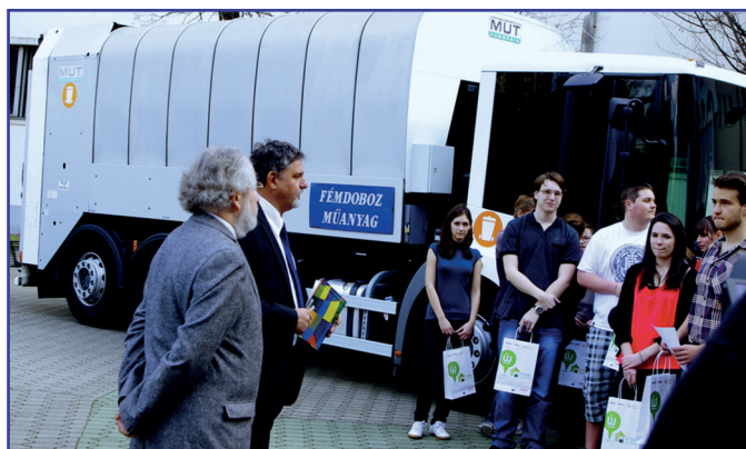
Kőbánya valamennyi otthonában szelektíven lehet gyűjteni