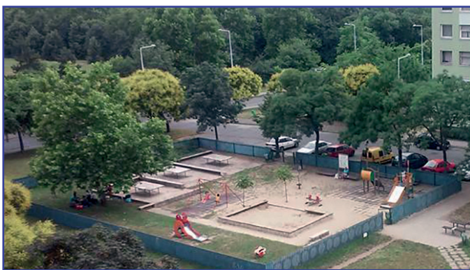
Játszóterén pihenő illegális határátlépők