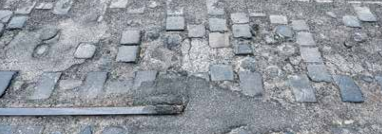
Egyre kevesebb ilyen út lesz a kerületben

A polgármester a kerület közlekedési terveiről szólva elmondta: elsőként a sokat használt közösségi terekhez, közintézményekhez és utakhoz látanak hozzá. „A közösségi közlekedés már érezhetően jobb lett a kerületben, megújult az 1-es és a 3-as villamos pályája, a kívánt időszakban új, alacsony padlós villamosok járnak, gázüzemű buszok álltak forgalomba, megújult és végre akadálymentes lett a Sibrik Miklós úti felüljáró, ami korábban sok problémát okozott a mozgásukban korlátozottaknak. Teljesen újjászületett és ma már bárhol Európában megállná a helyét a Kőrösi Csoma sétány, de felújítottuk a Jászberényi utat, a Maglódi út Sibrik Miklós út és Sírkert utca közötti szakaszán a macskaköves burkolattal teljes egészében elbontottuk, helyére új aszfaltburkolatot került, körforgalmat alakítottunk ki a köztemetőnél. Nemcsak kényelmi, de közlekedésbiztonsági szempontból is nagyot léptünk előre” – sorolta Kovács Róbert az eredményeket. Hangsúlyozta: a kerület nemcsak az autósokra, hanem a kerékpárosokra, gyalogosokra,