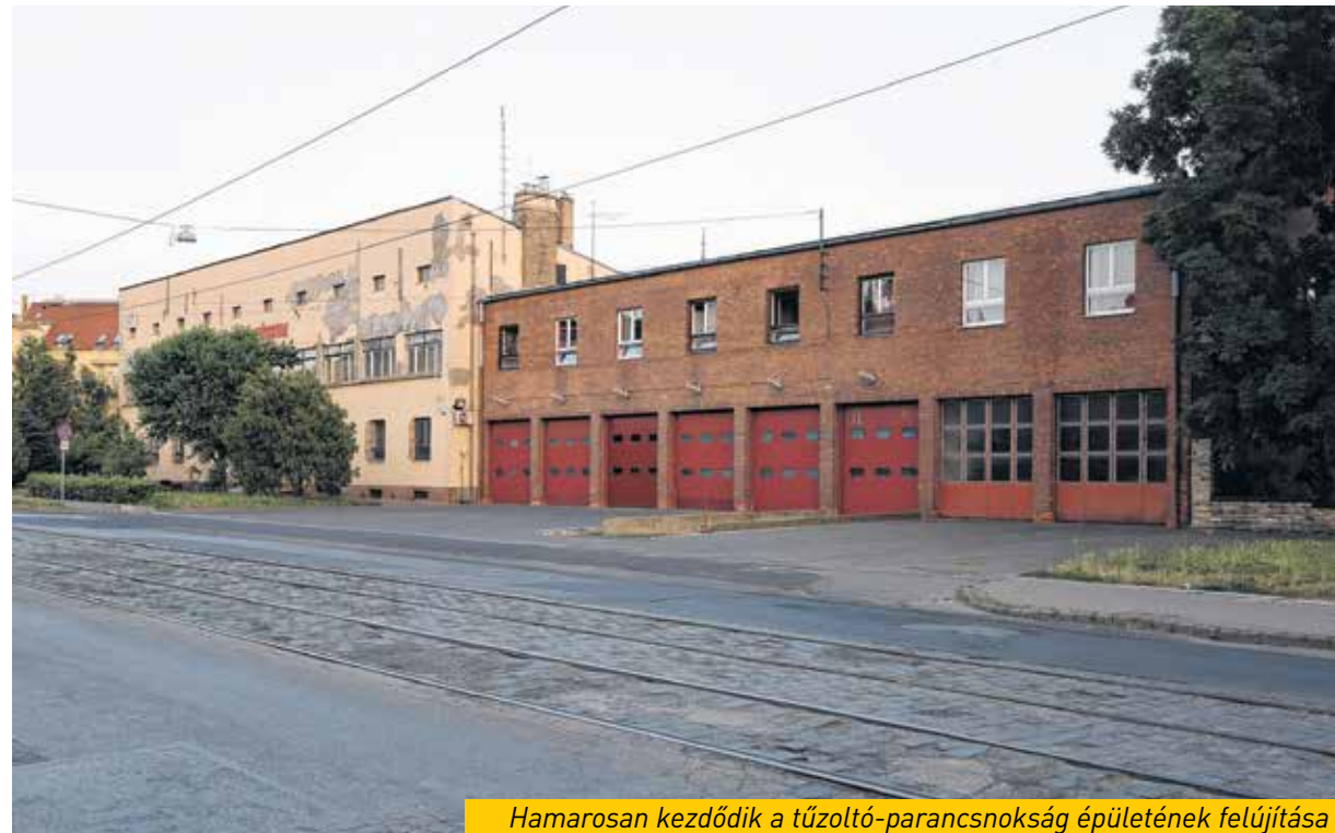
Hamarosan kezdődik a tűzoltó-parancsnokság épületének felújítása