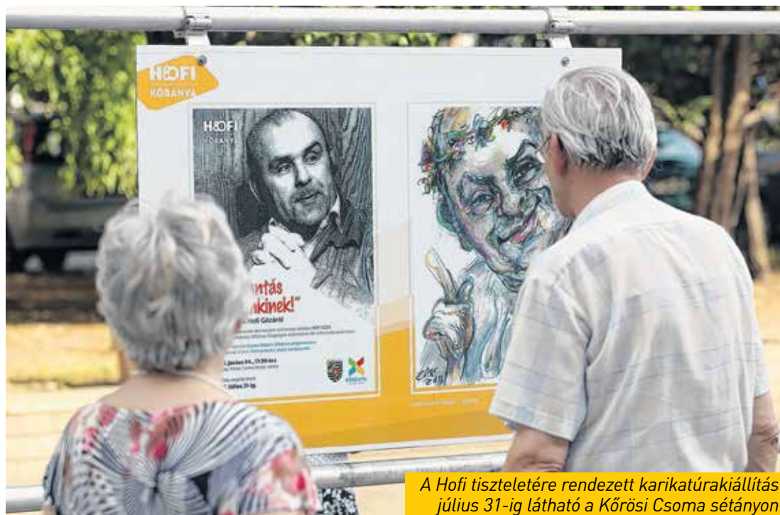
A Hofi tiszteletére rendezett karikatúra kiállítás július 31-ig látható a Kőrösi Csoma sétányon