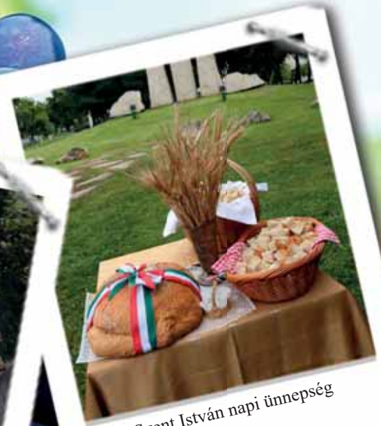
Szent István napi ünnepség (2. oldal)