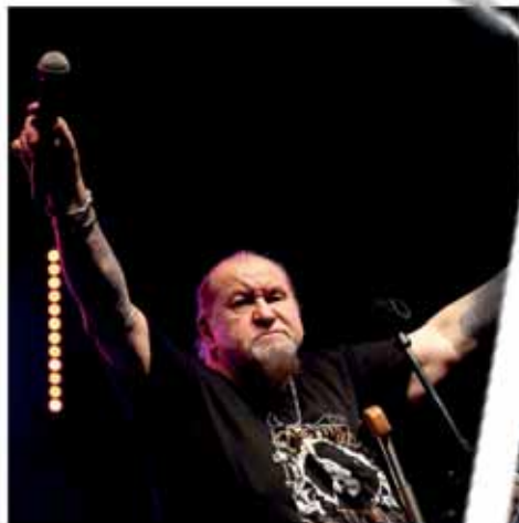
Kőbányai Blues Fesztivál (3. oldal)