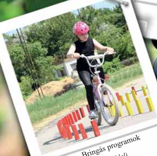
Bringás programok (4. oldal)