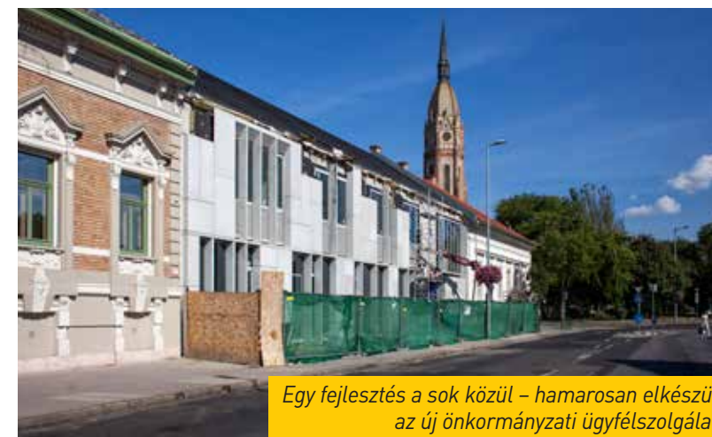
Egy fejlesztés a sok közül – hamarosan elkészül az új önkormányzati ügyfélszolgálat

„Az önkormányzatoktól kapott adatok, a honlapokon lévő információk és a választói megítélés alapján a legjobban teljesítő budapesti kerület Kő-