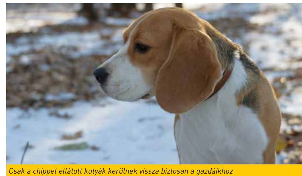
Csak a chippel ellátott kutyák kerülnek vissza biztosan a gazdáikhoz

E feladatok nem kis kihívást jelentenek a FEMÁ munkatársai számára. A szakember példaként említi, hogy noha ezt jogszabály írja elő minden kutyatulajdonos számára, becslése szerint a kőbányai kutyák 20-30 százaléka nem rendelkezik azonosító chippel, 2-3 ezer kutya egyáltalán nem is szerepel semmilyen nyilvántartásban, ráadásul az állatorvosok csak chippel rendelkező kutyákat oltanak be, például vesztettség ellen. A szolgálat, ha ellenőrzés vagy befogás során chip nélküli kutyával találkozik, jegyzőkönyvet vesz fel, majd az önkormányzat szabálysértési bírságot állapít meg. A bírság összege elérheti a 30 ezer forintot, ha csak az azonosító hiányzik. Ha kiderül, hogy nincs érvényes oltási igazolás, akkor már az illetékes kormányhivatal indít hatósági eljárást a kutyatulajdonossal szemben.