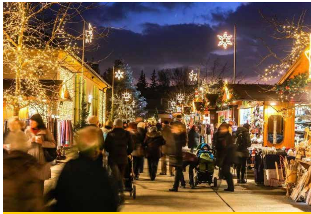
Mindenki örömet elrontja, ha gond van az ajándékkal

Alapprobléma, hogy a karácsonyi ajándékokat a háromnapos visszaváltási kötelezettség nem érinti, mivel az ünnepek eleve hosszabbak, ráadásul ideális esetben az ajándékokat sem az ünnep előestéjén szokás megvenni. Kivételes karácsonyi szabály nincs, úgyhogy – mint azt a Nemzeti Fogyasztóvédelmi Hatóság szóvivőjétől megtudtuk – hibátlan termékeket a három nap lejáratá után a kereskedő nem köteles visszavenni. Ha ezt a lehetőséget üzletpolitikai megfontolásból mégis biztosítja a számunkra, akkor is érdemes már a vásárláskor az esetleges kicseréléssel kapcsolatos ígéretet a nyugtára is ráírni, hogy később igazolni tudjuk. A vásárlást igazoló dokumentum hiányában végképp csak az adott kereskedőn múlik, hogy hajlandó-e cserélni vagy a vételárát visszaadni.