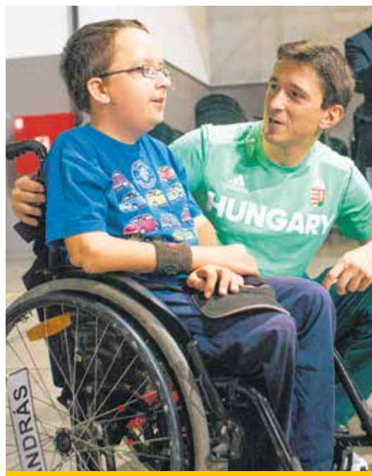
Nagyon sok, gyermekeket érintő jótékonyági rendezvényen vesz részt

– Igen, most már engem is felismernek. Sőt! Bárhol vagyok, odajönnek, gratulálnak. Nemrég még az autóm ablaktörlője alatt is találtam egy utcabeliek által aláírt gratulációt. Nagyon kedves gesztus volt.