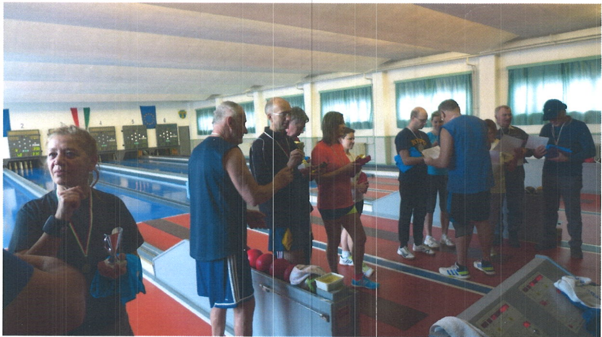
2018. januári díjátadás

A támogatást a díjazás költségeire fordítottuk, úgymint érmek, serlegek, feliratok. A megyei bajnokságban a sokéves verhetetlenségünket most bronzéremre cseréltük, mert női csapattagunk az év második felétől első kisbabájával az édesanyjai teendőket gyakorolta. Az eredményre így is büszkék lehetünk.