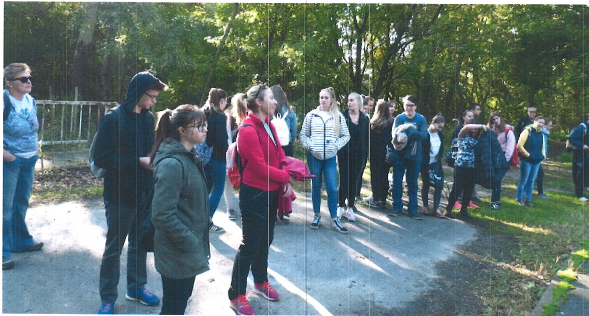
Kőbányai Diák Túraversenyét terveknek megfelelően megszervezte, igen nagy érdeklődéssel.