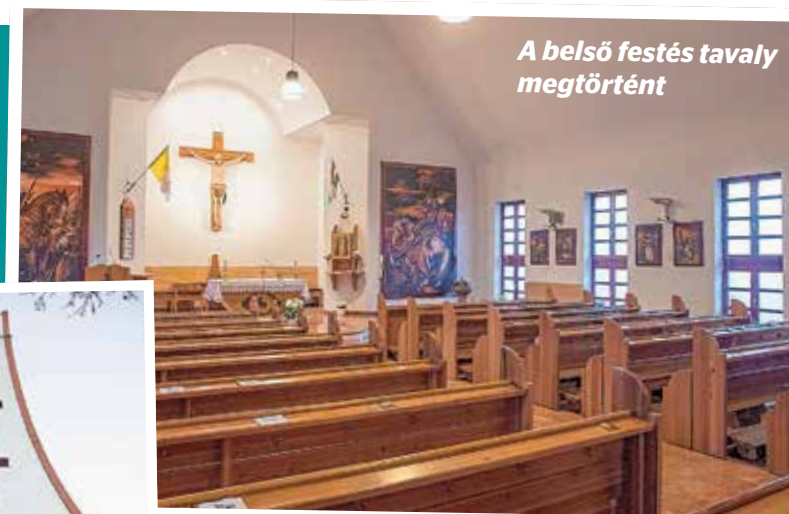
A belső festés tavaly megtörtént

A BBU Non-profit Kft. szervezte Nagy Sportágválasztó rendezvények idei megtartásához is kétmillióval járul hozzá a város. Cserébe a cég Kőbányát kiemelten jeleníti meg a több ezer gyermek, szülő és tanár által látogatott eseményen.