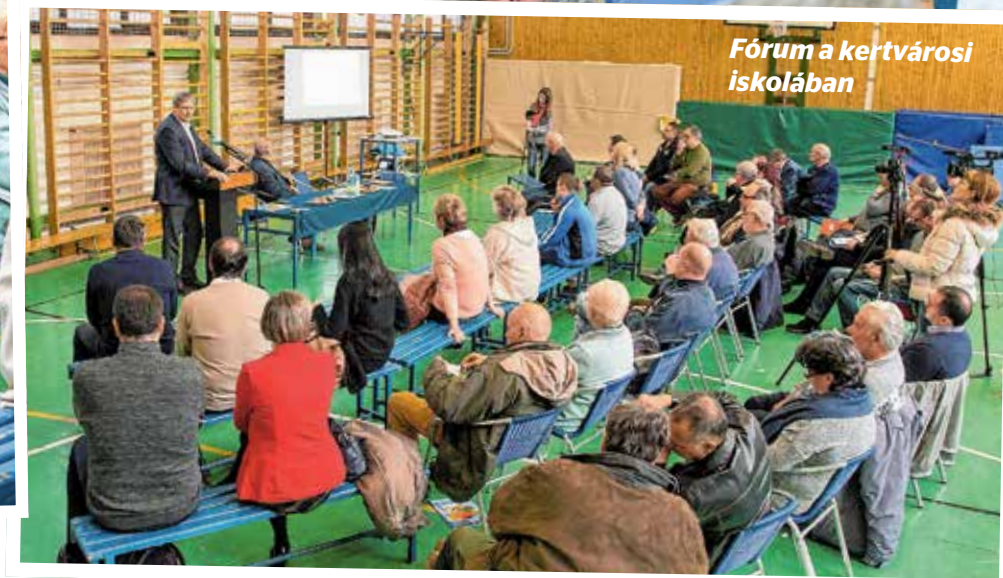
Fórum a kertvárosi iskolában

A polgármester első útja a Kertvárosba vezetett, ahol hálás feladat várta: százezer ötletbörzét tarthatott. A beruházó Continentalnak ugyanis a