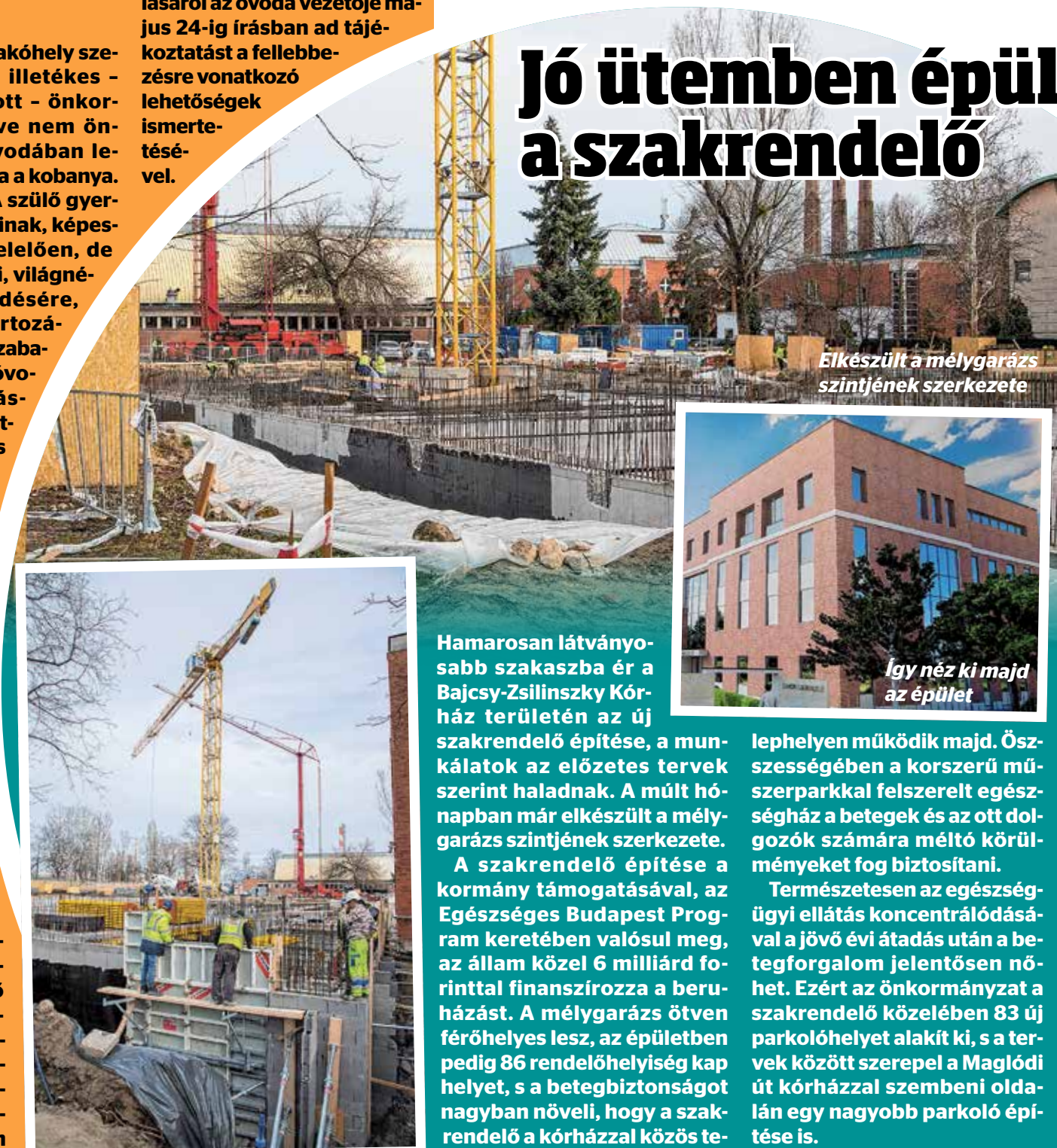
Elkészült a mélygarázs szintjének szerkezete