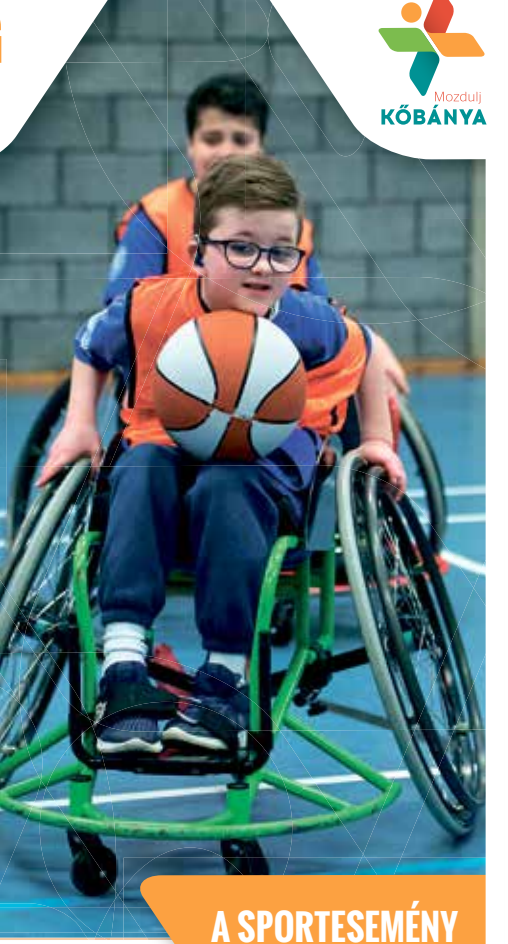
A SPORTESEMÉNY INGYENES!

Kedves Kőbányaiak! Szeretettel várjuk Önöket, várunk Benneteket a Mozdulj Kőbánya rendezvénysorozat és pontgyűjtő akció következő eseményére, a 2019. május 3-án (pénteken) 9.00 - 14.00 óra között megrendezendő "Esélyegyenlőség Napja" programunkra! Az eseményen találkozhatnak magyar élvo paralimpikonokkal (Hajmási Éva 2012. évi Világkupa ezüstérmese, paralimpiai ezüstérmes sportoló, Osváth Richárd paralimpiai bronzérmes, és kétszeres ezüstérmes versenyző, a 2017. évi paralimpiai sportoló) és edzőikkel (Beliczy Sándor élvo mesteredző, a 2017. és a 2018. évi paralimpiai edzője), a magyar női ülőrolabda válogatott játékosával és edzőjével, valamint a Ferencváros női labdarúgó csapatának tagjaival. Helyszín: Kocsis Sándor Sportközpont (1107 Budapest, Bihari u. 23.) Védnök: Szekeres Pál, fogyatékos emberek társadalmi integrációjával kapcsolatos feladatok ellátásáért felelős miniszter biztosa