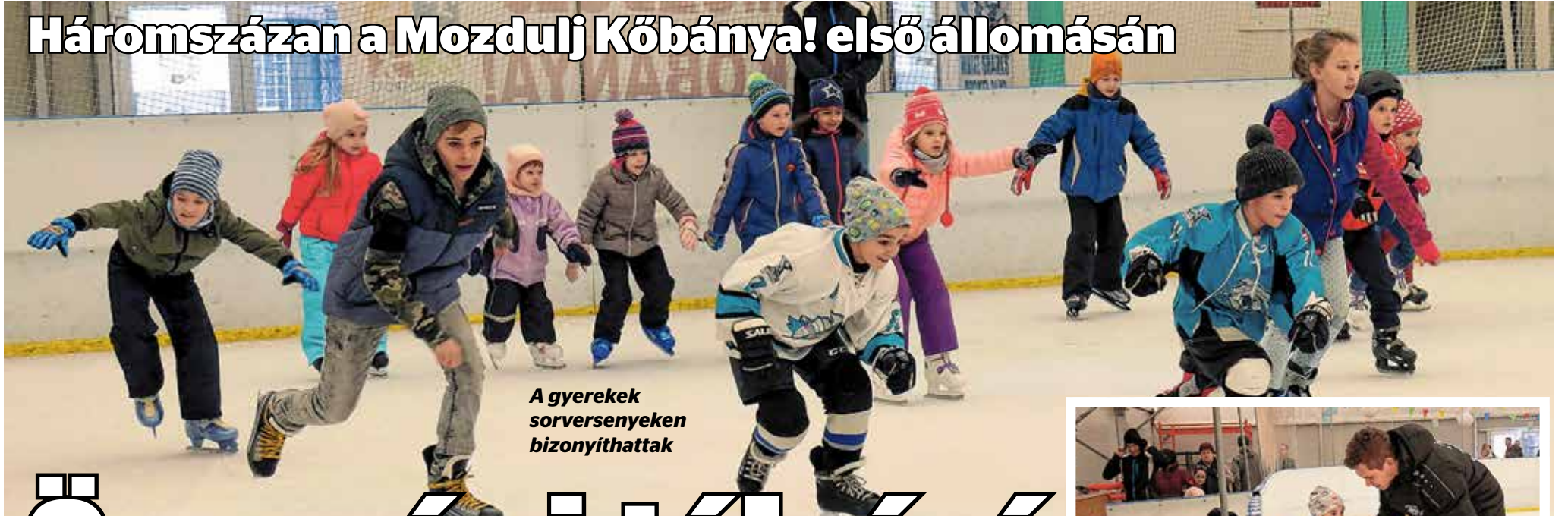
A gyerekek sorversenyeken bizonyíthattak