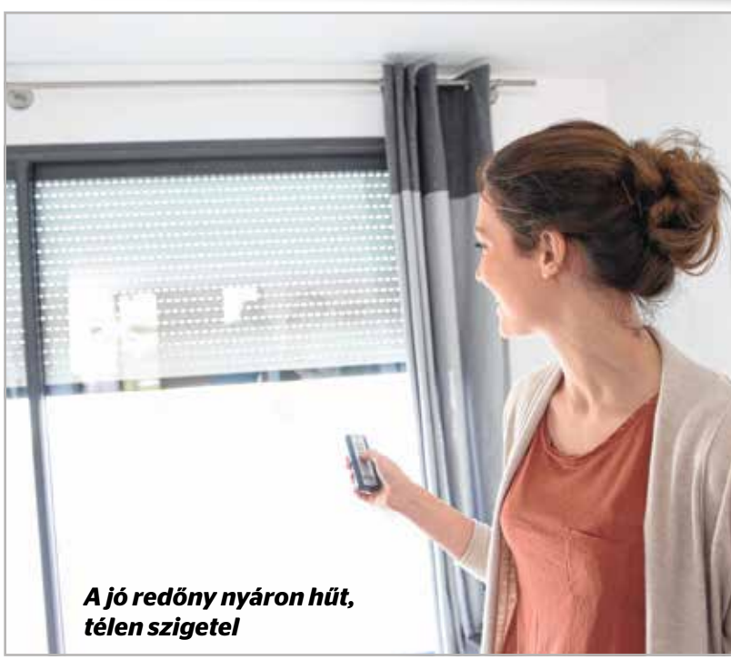
A jó redőny nyáron hűt, télen szigetel

Igy működik a hőszivattyú A határozat kiter arra, hogy hőszivattyú telepítéséhez is igényelhető az önkormányzati forrás. Ez a megoldás már kevésbé ismert, ugyanis működése bonyolult, és a kiépítése sem olcsó. A hőszivattyú gyakorlatilag a környezetétől von el hőt, s azal fűti a házat, lakást – vagyis úgy működik, mint egy hűtőgép, csak ellenkező céllal. A hőt a földbe fektetett csővezetékken át veszi fel a rendszer, és nyomás alatt adja le – utóbbi miatt energiabefektetésre van szükség. A hőszivattyú a betáplált energia 2-4-szeresét tudja értékes hőenergiaként leadni, vagyis a fűtési költség 25-75 százalékkal csökkenhet.