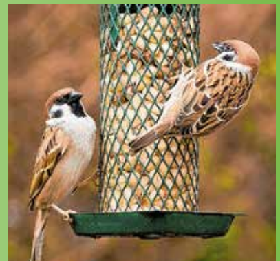
állatok világnapja alkalmából előadások és rendezvények keretében lehet tájékozódni a felelős állattartásról.

A képviselő-testület egyhangúlag fogadta el azt az előterjesztést, ami az idei évre tervezett formáló akciókról adott tájékoztatást. Eszerint folytatódik a komposztálási program, valamint a zöld hulladék szabályos gyűjtésére az önkormányzat idén is biztosít ingyenes zsákokat. A Madarak és fák napja akció keretében többek között újabb tájékoztató táblák kerülnek ki a közterületeinkre található különlegesebb fákról, a program a téli madáretetés népszerűsítésével is kiegészül. Ezen felül a „Madárbarát kert”-akció azon lakók igyekeztét isméri el, akik a városból eltűnő énekesmadarak számára fészkelőhelyet segítenek biztosítani. Elindul a „Fogadj örökre egy fát” program is (erről bővebben a 9. oldalon olvashatnak), valamint környezettudatos kézműves szakkör szervezése mellett Kőbánya az Európai Hulladékcsökkentési Héthez is csatlakozik. Októberben pedig az állatok világnapja alkalmából előadások és rendezvények keretében lehet tájékozódni a felelős állattartásról.