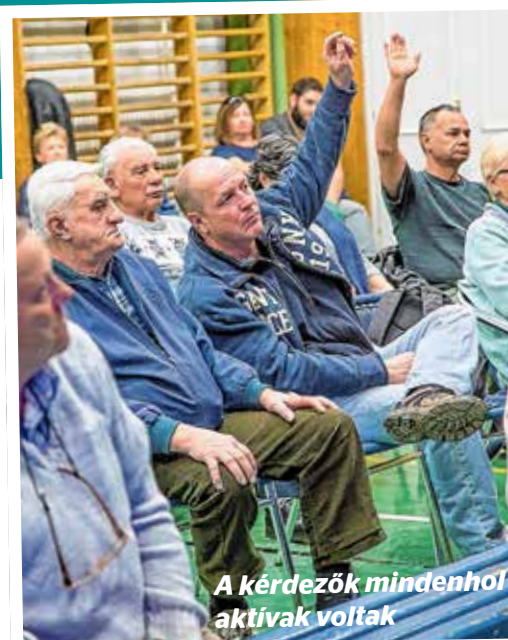
A kérdések mindenhol aktívák voltak

Élénk érdeklődést váltott ki idén is a D. Kovács Róbert Antal polgármester által indított eseménysorozat: a polgármester március vége és április eleje között a város hét helyszínén tartott lakossági fórumokat. A vezető beszámolt az elmúlt évek eredményeiről, így többek között a város stabil anyagi helyzetéről, a jelentős beruházásokról vagy az intézmények megújításáról. A találkozó fő célja a közös tervezés és a lakosság kérdéseinek megválaszolása volt, ezért a polgármestert alpolgármesterei, önkormányzati képviselők, a városüzemeltetésért felelős szervezetek képviselői, a hivatal munkatársai, valamint Dr. Gyetvai Tibor rendőrkapitány is elkísérték.