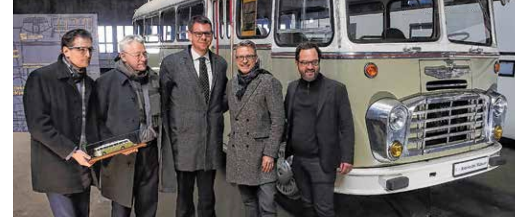
Tarlós István gratulált a nyerteseknek

A győztesek az elmúlt négy évtizedben sorra nyerték el a legjelentősebb észak-amerikai múzeumi és köztérfejlesztési projekteket, de ők fejlesztették Moszkva szívében a 13 hektáros Zaryadje parkot is.