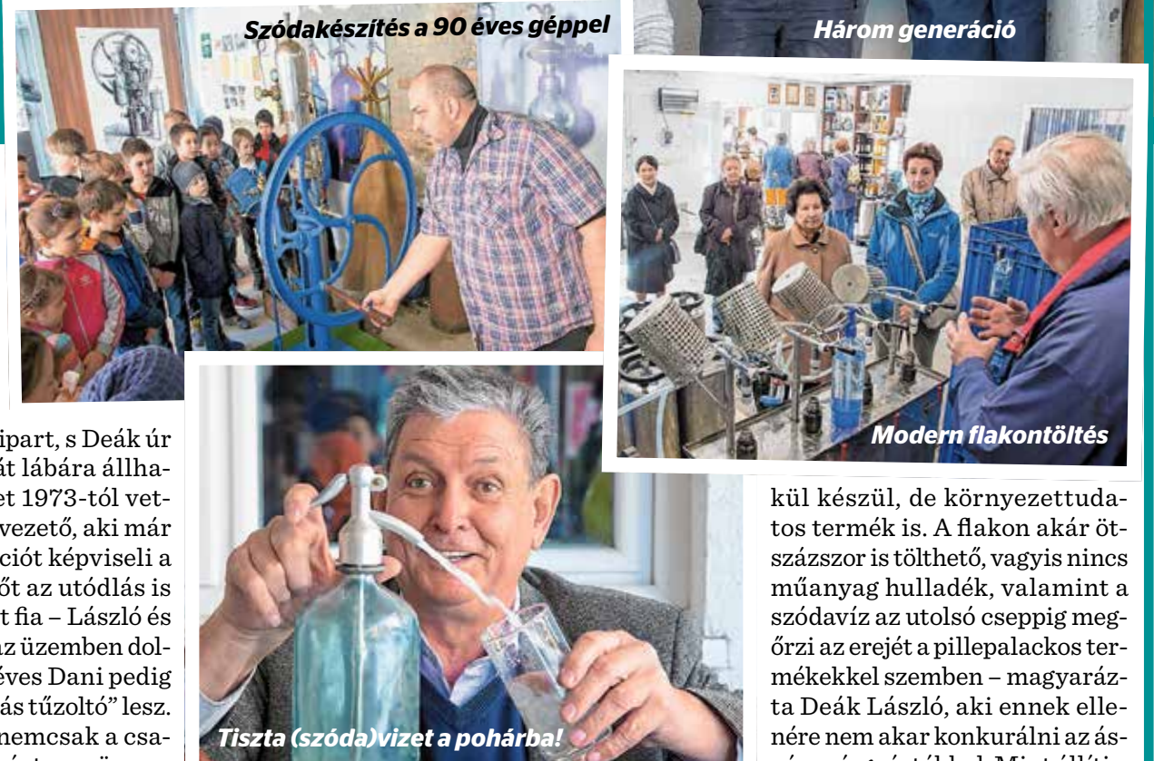
Szódakészítés a 90 éves géppel