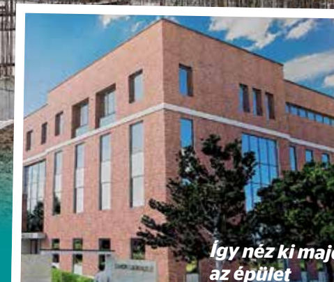
Igy néz ki majd az épület

Hamarosan látványosabb szakszoba ér a Bajcsy-Zsilinszky Kórház területén az új szakrendelő építése, a munkálatok az előzetes tervek szerint haladnak. A múlt hónapban már elkészült a mélygarázs szintjének szerkezete. A szakrendelő építése a kormány támogatásával, az Egészséges Budapest Program keretében valósul meg, az állam közel 6 milliárd forinttal finanszírozza a beruházást. A mélygarázs ötven férőhelyes lesz, az épületben pedig 86 rendelőhelyiség kap helyet, s a betegbiztonság nagyban növekszik az új szakrendelő a kórházzal közös te-