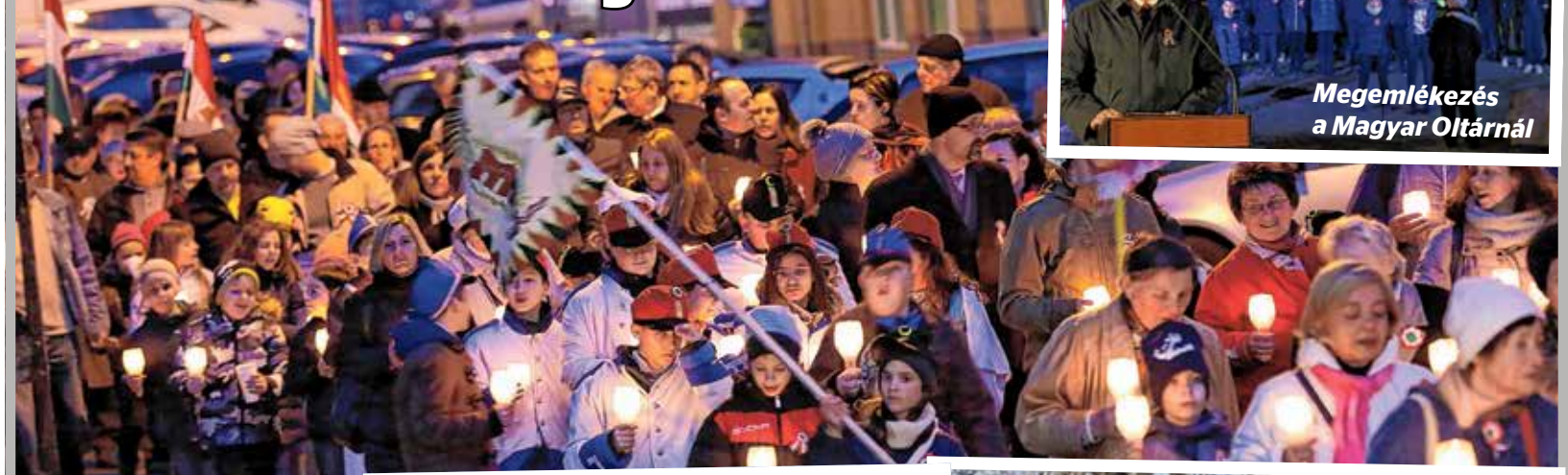
Megemlékezés a Magyar Oltárnál