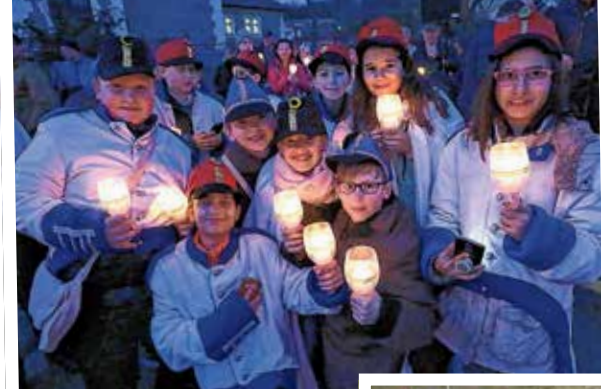
Huszártábor a KÖSZI előtt

Több százan, köztük szép számban fiatalok emlékeztek meg az 1848-as forradalom hőseiről az ünnep előestéjén. Március 14-én a tömeg a Conti-kápolna előtt gyülekezett, s miközben egyre többen érkeztek, a zenészek forradalmi nótákat hangoztattak, huszárruhába öltözött gyermekek pedig a fáklyák meggyújtásában segítettek.