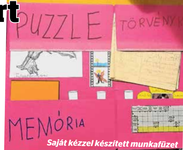
Saját kézzel készített munkafüzet