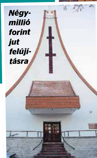
Négy millió forint jut felújításra