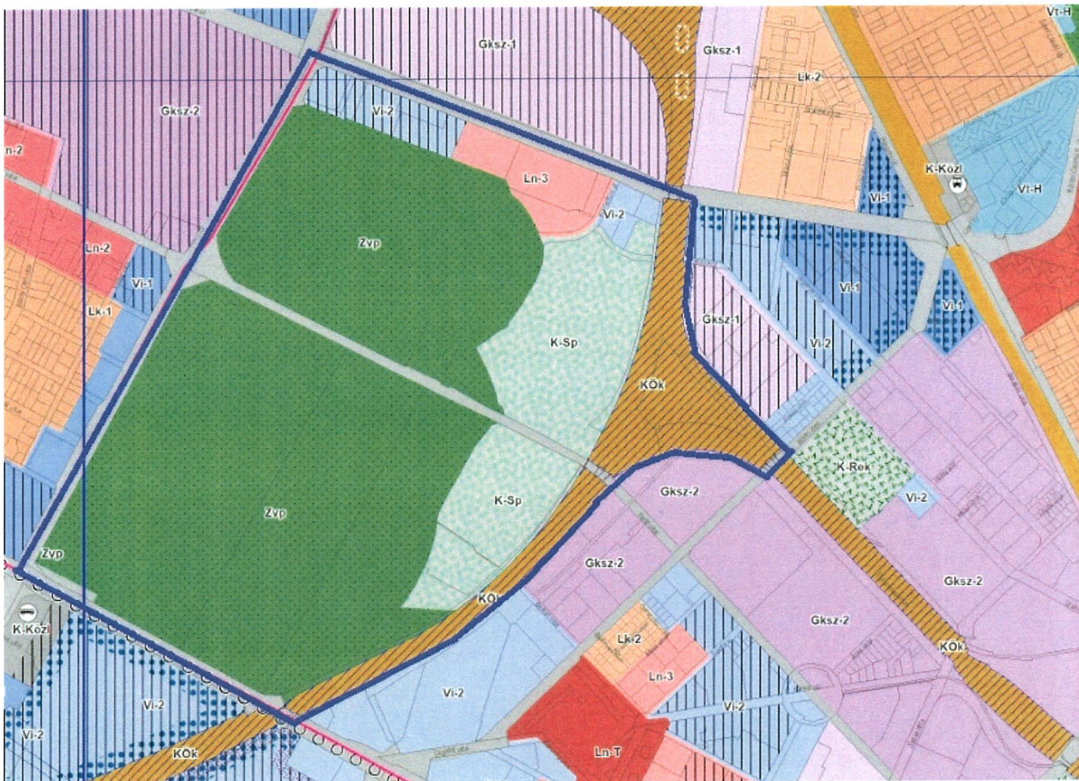
Népliget területi lehatárolása