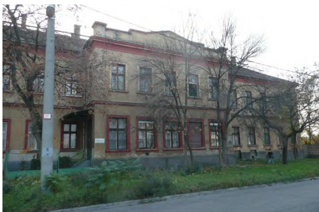
Szállás utcai homlokzat