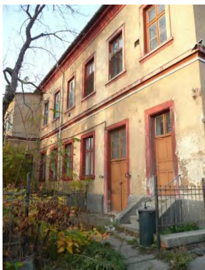
Az épület hátsó homlokzata