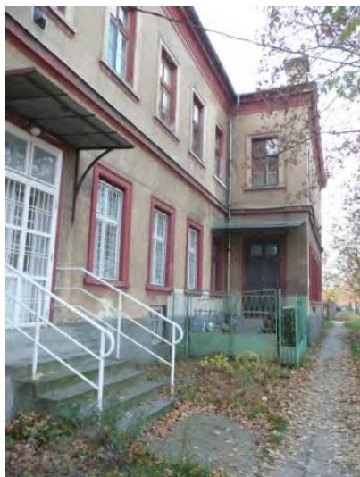
A Szállás utca felől