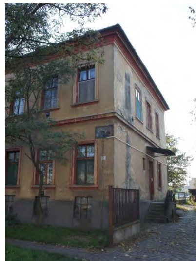
Az épület északkeleti sarka