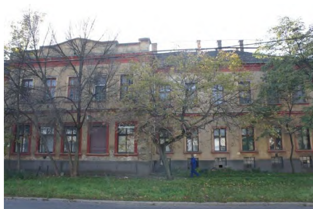
Az épület középső, illetve északi traktusa