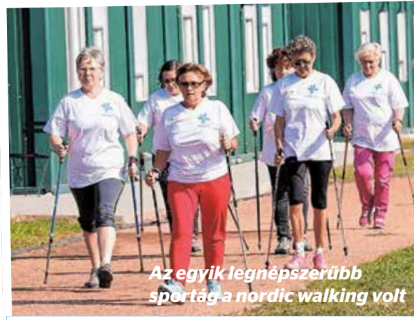
Az egyik legnépszerűbb sportág a nordic walking volt