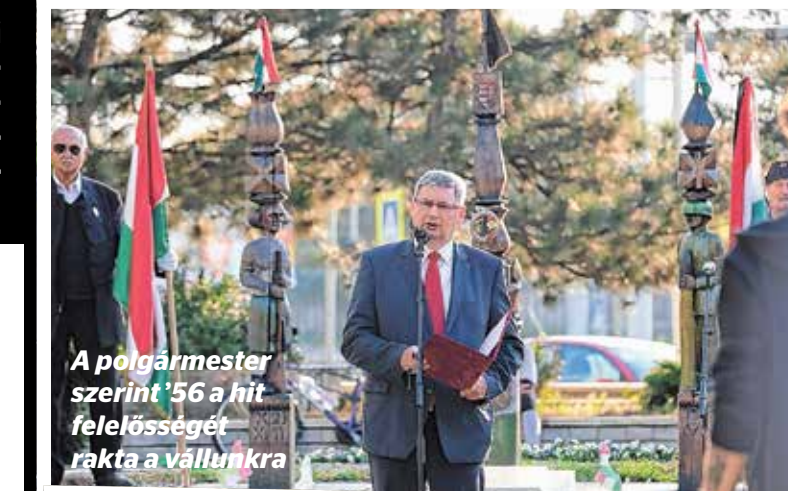
A polgármester szerint '56 a hit felelősségét rakta a vállunkra'

Október 23-án a Kőrösi Csoma sétányon, míg november 4-én az Élessaroknál hajtott fejet a kerület 1956 hőseinek és mártírjainak emléke előtt.