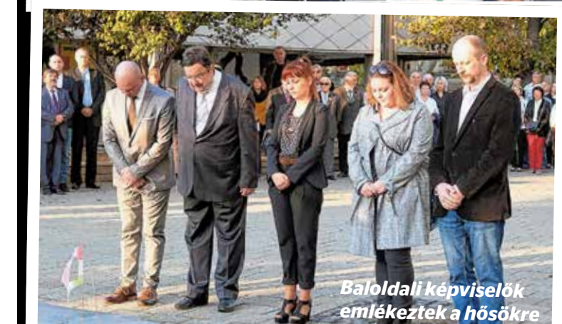
Baloldali képviselők emlékeztek a hősökre

A forradalom leverésének napján, november 4-én az Élessaroknál koszorúzták az önkormányzat. Radványi Gábor a beszédében külön kiemelte a szabadságharcos Silye Sámuel hősiességét, aki Kőbánya elestét követően nem bujdosott el.