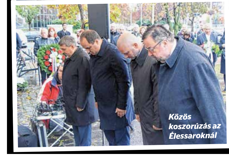
Közös koszorúzás az Élessaroknál

bűnösnek egy hazafi? – tette fel a kérdést az alpolgármester. – Egy ideig '56-ban is hazafinak tartották, ám november 4-e után már belőle is ellenforradalmárt kreáltak, és 1959-ben kivégezték – mondta. A nemzeti gyásznapon különleges menet indult a kerület központjából az Új Köztemetőbe: a Kőbányai Bringás