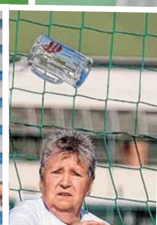
Repül a nehéz söröskorsó