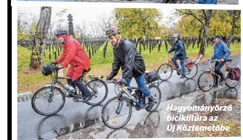
Hagyományörző biciklitúra az Új Köztemetőbe