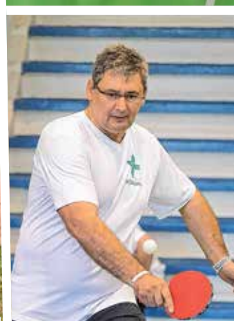
Polgármester a senior mezőnyben

tály egyik legnagyobb kerületi bulija, és rendre újdonságokat is kipróbálhatnak a vállalkozó kedvűek. Idén bárki megismerkedhetett a súlylökés módosított változata, a söröskorsólökés rejtelmével. A férfiak között pedig a dartsfoci tarolt: