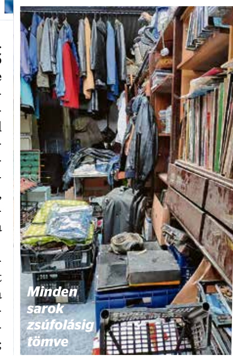
Minden sarok zsúfolásig tölve