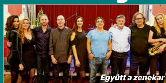
Együtt a zenekar