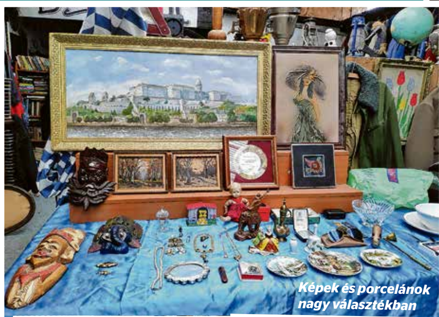
Képek és porcelánok nagy választékban

A piacon majd egy tucat eladó árujából lehet válogatni,