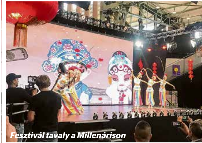
Fesztivál tavaly a Millenárison

A szervezők a holdújévről és az ehhez kapcsolódó kínai hagyományokról is beszéltek. Az