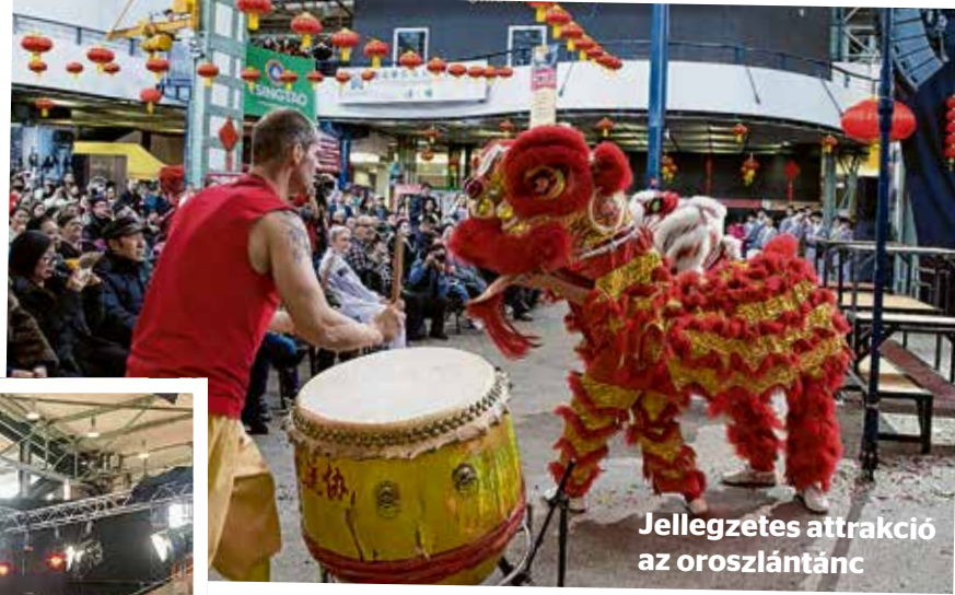
Jellegzetes attrakció az oroszlántánc