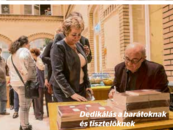
Dedikálás a barátoknak és tisztelőknek