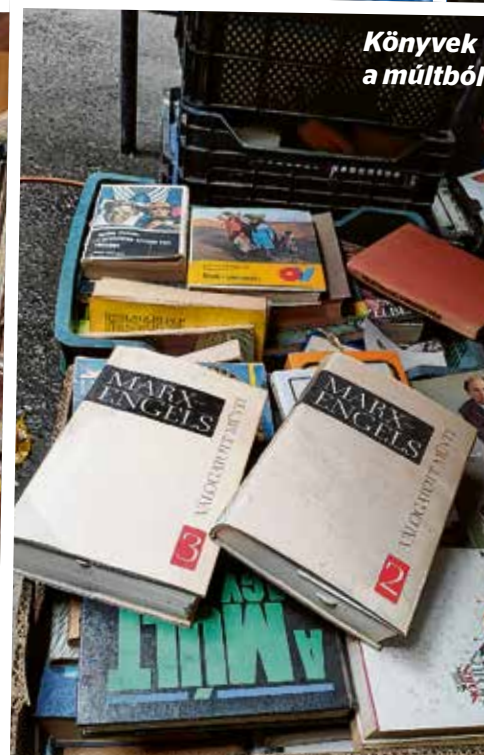
Könyvek a múltból