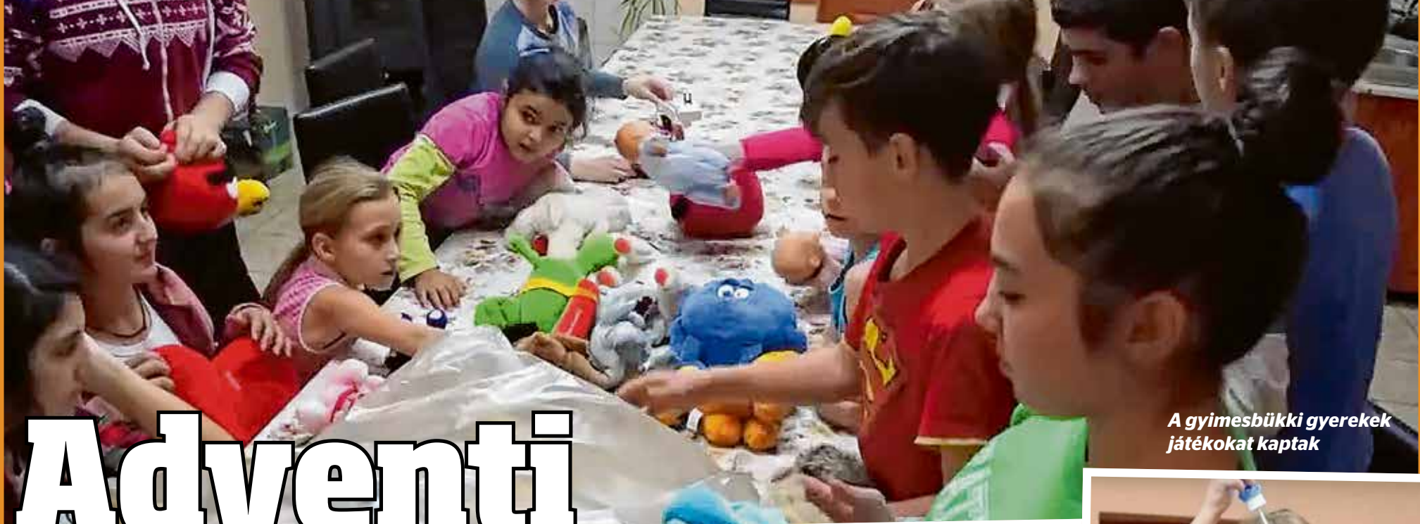
A gyimesbükki gyerekek játékokat kaptak