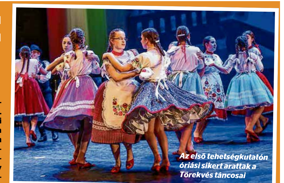
Az első tehetségkutatón óriási sikert arattak a Tőrekvés táncosai

A két évvel ezelőtti megszervezett első Kiben van az X? óriási sikert aratott, a versenyzők mintegy félszáz produkciót készítettek. Az előadások színvonalát és az előadók profizmusát mi sem mutatta jobban, hogy a művelődési központ döntőjét követően a kőbányai közönség számos további alkalommal találkozott a legjobbakkal. A jó helyezést el-