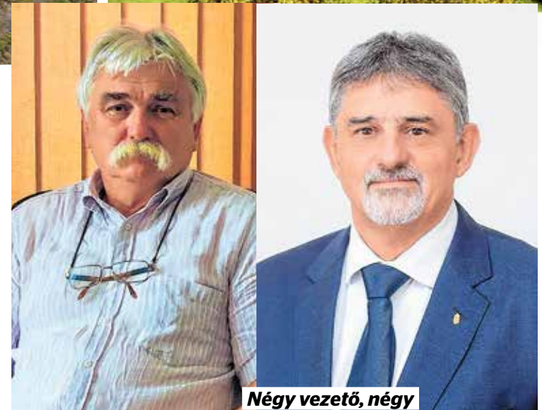
Négy vezető, négy vélemény – közös terv

lehet majd rendezni, de a KSC szakosztályvezetője alapvetően munkamedencének számja. Az elsőbbség a versenysportolóké lenne, ugyanakkor az ő idősávjai között a medencét úszni tanuló gyermekek és mozgást kedvelő hétköznapi emberek vehetnék birtokba. „Az önkormányzat előnyös üzletet kötött, mert a telkek fejében hiánypótló létesítményeket kap Kőbánya” – teszi hozzá Magyarország legeredményesebb úszószakosztályának vezetője.