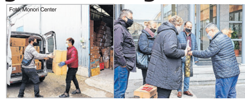
vábbra is segítjük egymást, azal melegséget és reményt tudunk csempészni az ünnepi időszakba.

750 darab egészségügyi védőoverállal segíti a Szivárvány Idősek Otthonának és a BÁRKA Kőbányai Humán-szolgáltató Központ Családsegítő Szolgálatának működését a járványhelyzetben a Monori Center (a Budapesti Chinatown). Mint írják: idén különös és nehézségekkel teli karácsony és szilveszter vár ránk, de reméljük, hogy ha-