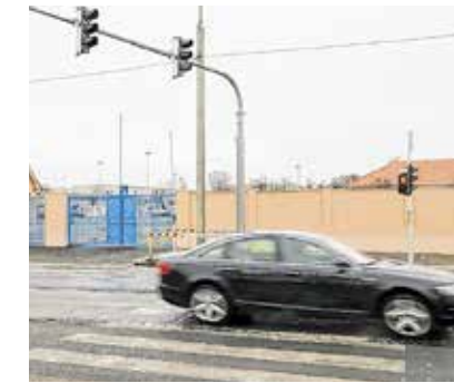
készre, így a lámpák bekötését csak ezután lehetett elkezdni.

re tavaly elkészült a vezetékek lefektetéséhez szükséges első terv, ám ez alapján az egyik vezérlőszekrény műemléki épület elé került volna, így a nyomvonalat módosítani kellett. A Budapest Közút szerint az ELMŰ hosszadalmas átfutási idővel végezte a tervezést, azt csak idén január 20-án jelentették