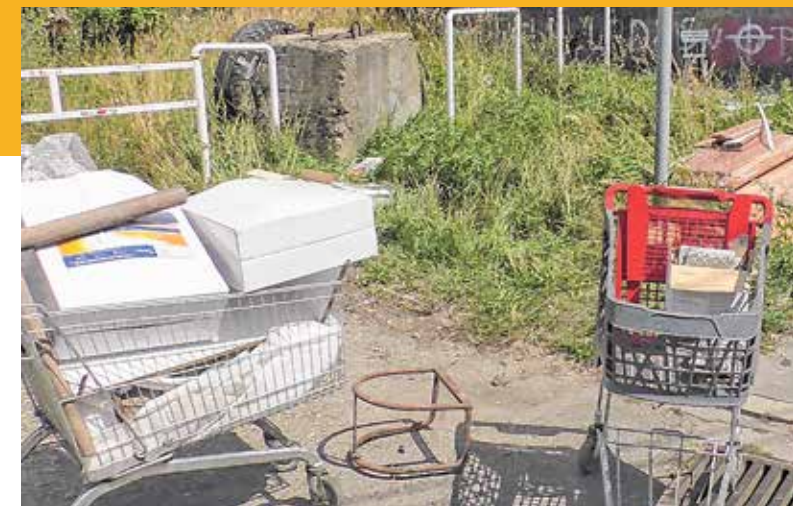
köz is biztosít. Hosszabb távon a személtelválasztás a megoldás, a kerület ezért is csatlakozott az országos „Te Szedd” mozgalomhoz, és a „Föld napi” takarítási akcióhoz is.

Kőbánya közterületei és magánkertjei 4-5000 tonna zöld hulladékot „termelnek” minden évben. A mennyiség közel harmada „illegálisban” végzi, noha a fanyesedék és a kaszált fű érték, komposztban a helye, amihez az önkormányzat esz-