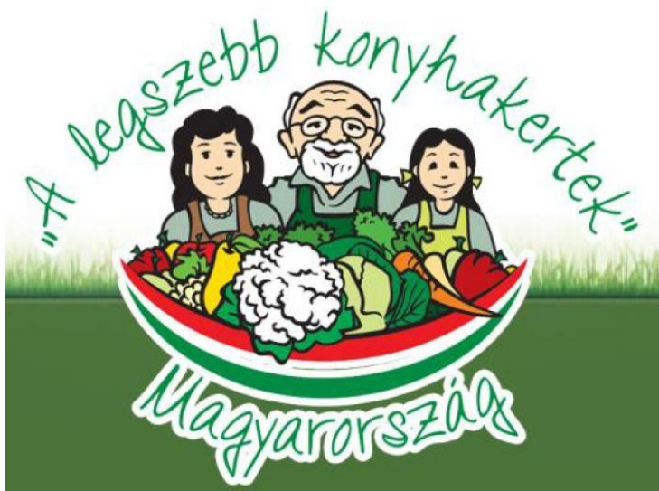
A verseny logója

Technikum és Szakképző Iskola SNI tanulócsoportja a Budapest X. kerület, Maglódi út 8. szám alatt található zöldségekertjével. Mini kert kategóriában egy magánzöldségekert is országos elismerést kapott.