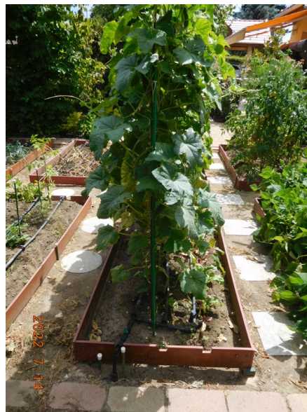
Díjazott konyhakert a Bojtocska utcából