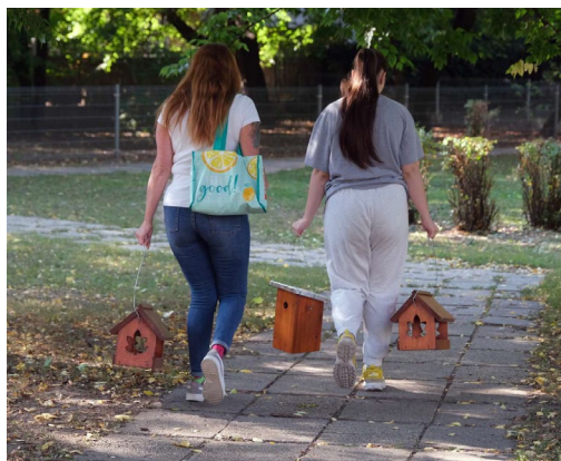
Az elismerő tábla és a már átvett madárbarát eszközök

Az eszközökre 97 jelentkező nyújtotta be az igényét. Összesen 75 madárodú és 88 madáretető talált gazdára. Az akcióban a már korábbi időszakban is aktív madárbarát kertek tulajdonosai „Madárbarát kert” elismerő táblát kaptak, amely 23 ingatlant érintett.