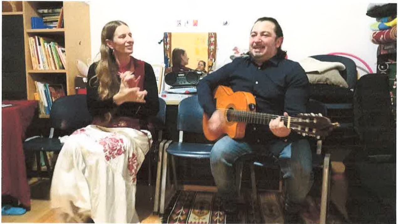
A Hold-dala-Nap zenekar házi koncertje