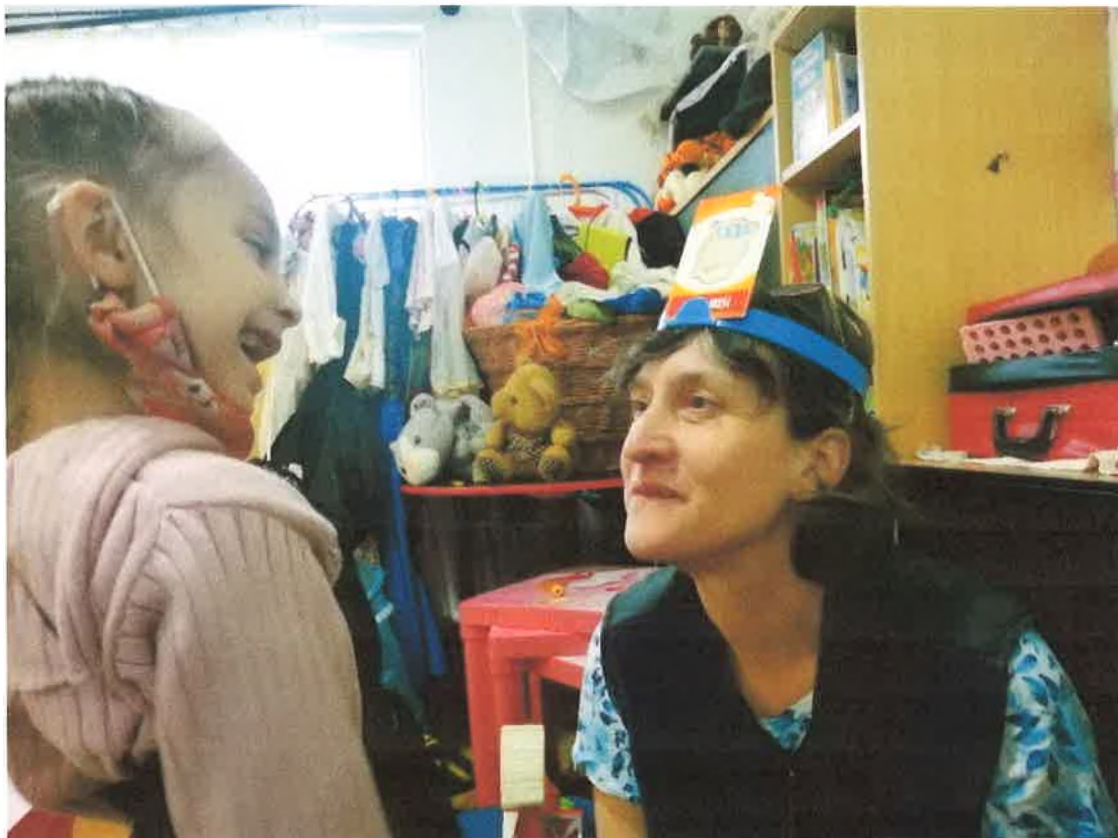
Játékterápia, kreatív foglalkozás