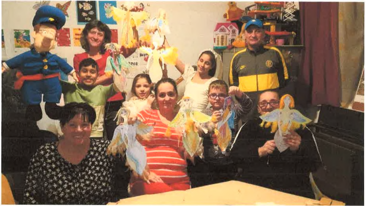
Adventi készülődés, angyalka készítés