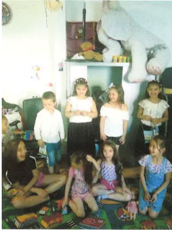
Elballagtak az óvodások