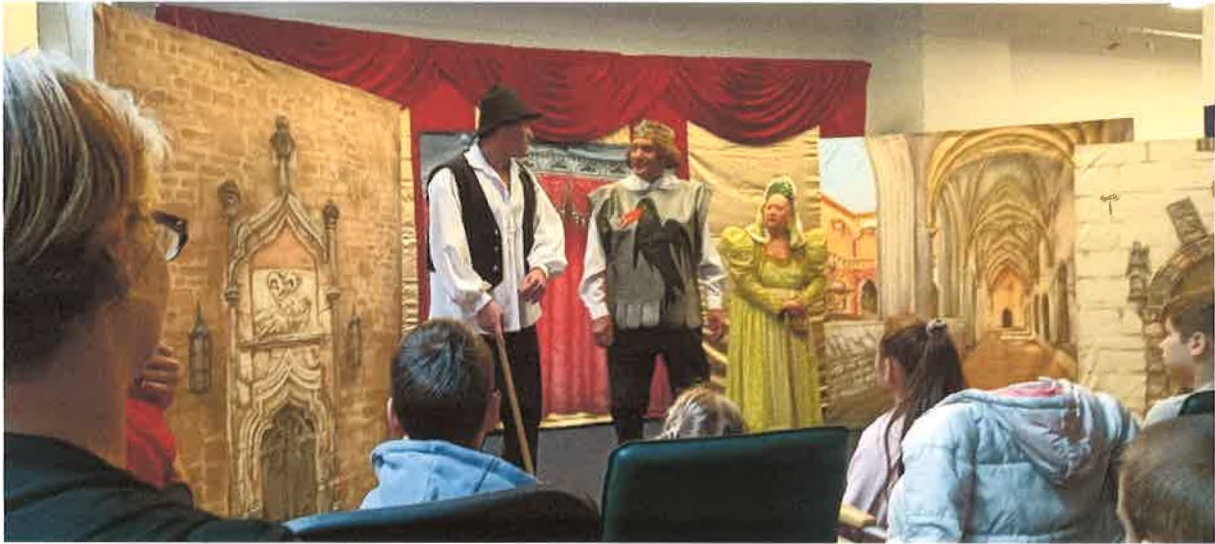
Mátyás király meseszínházi előadás