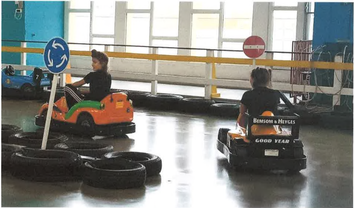
Látogatás a Minipolisz-ban