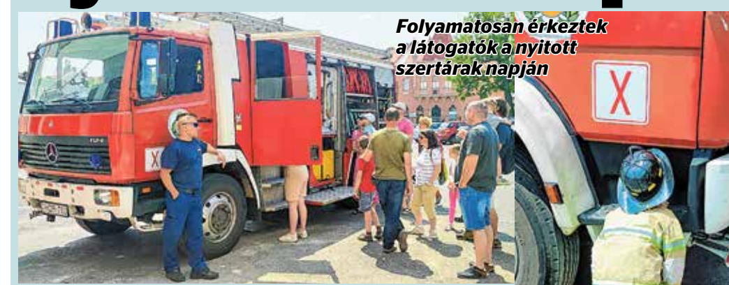
Folyamatosan érkeztek a látogatók a nyitott szertárak napján

Közel 1200 alkalommal riasztották tavaly a kőbányai tűzoltókat, ebből 135-ször volt szükség a magasból mentő, 129-szer a műszaki mentő gépjárművükre. E két eszközön kívül egyébként a kerületi katasztrófavédelem további két gépjárműfecskenővel rendelkezik – számolt be a képviselő-testületi ülésen a X. kerületi Hivatásos Tűzoltó-parancsnokság ülésén Karas Jenő tűzoltóparancsnok. Az esetek többsége a legalacsonyabb, I-es riasztási fokozatba tartozott, de előfordult olyan eset is, ahova 3-4 rajnak kellett kivonulnia. Fontos tudni, hogy az összes riasztási szám nemcsak a kerületi eseteket takarja, hiszen a kőbányai tűzoltók illetékeségi területe ennél jóval bővebb, szükség esetén máshova is riasztják őket. A kerületben 308 tüzeset-höz és 573 műszaki mentéshez kellett kivonulniuk.