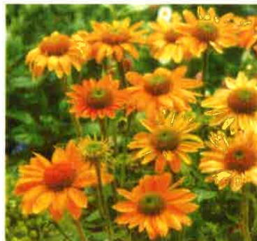
Echinacea purpurea Mellow Yellow 10 db