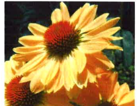
Echinacea purpurea Aloha 12 db