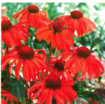
Echinacea Red Magnus 10 db