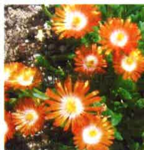
Delosperma 'Jewel of Desert Topaz'