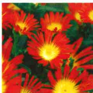
Delosperma Fire Wonder