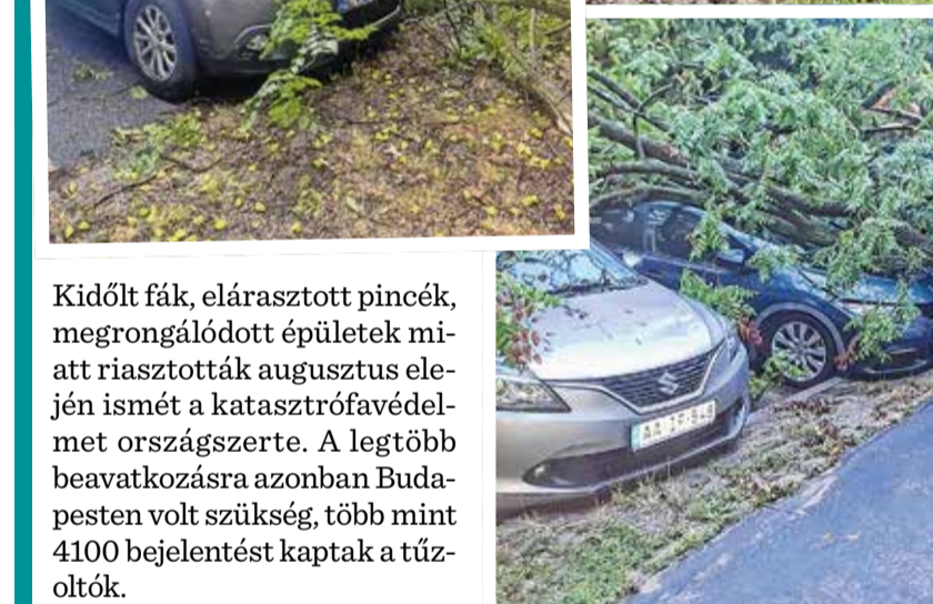
Kidőlt fák, elárasztott pincék, megrongálódott épületek miatt riasztották augusztus elején ismét a katasztrófavédelmet országsszerte. A legtöbb beavatkozásra azonban Budapesten volt szükség, több mint 4100 bejelentést kaptak a tűzoltók.

Kőbányát is súlyosan érintette a vihar, a közösségi oldalakon közzétett fotók elárasztott utcákról, autókra dőlt, tövestől kicsavart fákról mutatnak riasztó képeket. Bár viharok az elmúlt években is voltak, például, olyanra, mint idén, nem mondja Somlyódy Csaba városüzemeltetésért felelős alpolgármester. A kerület összesítése szerint az orkánerejű szél 187