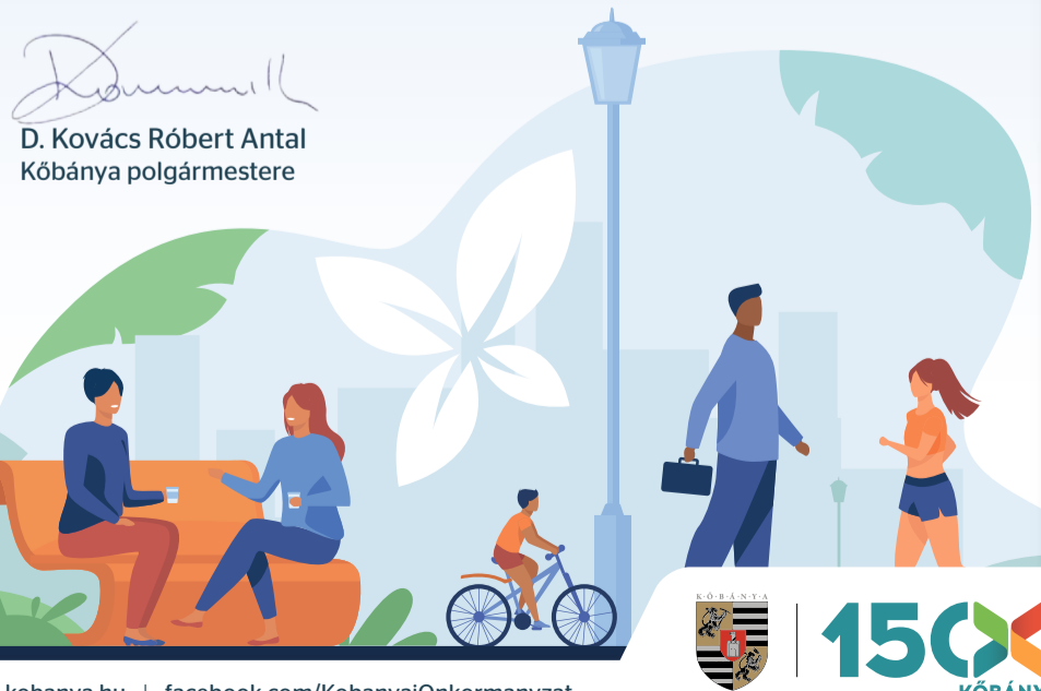
D. Kovács Róbert Antal Kőbánya polgármestere