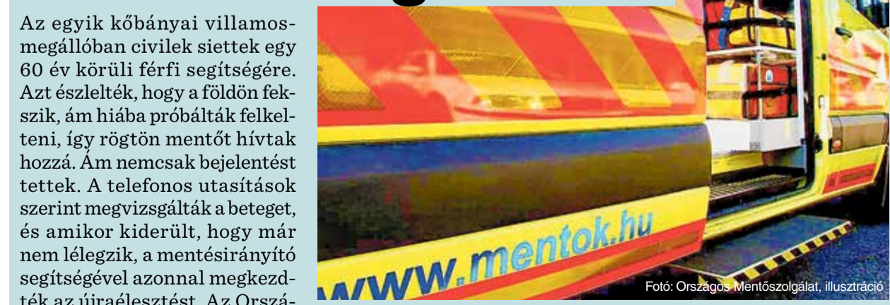
Fotó: Országos Mentőszolgálat, illusztráció

Az egyik kőbányai villamosmegállóban civilek siettek egy 60 év körüli férfi segítségére. Azt észlelték, hogy a földön fekszik, ám hiába próbálták felkelteni, így rögtön mentőt hívtak hozzá. Am nemcsak bejelentést tettek. A telefonos utasítások szerint megvizsgálták a beteget, és amikor kiderült, hogy már nem lélegzik, a mentésirányító segítségével azonnal megkezdték az újraélesztést. Az Országos Mentőszolgálat közlése szerint a villamosmegállóban kisebb tömeg gyűlt össze, akik az utasításokat követve, egymást percekkel belül kiterítették a percekkel belül kiterített mentőegység már stabil állapotban szállíthatta kórházba a férfit.