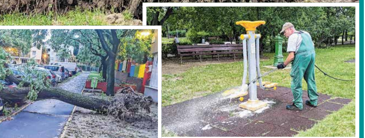
A viharok felszámolását a Kökert munkatársai a tűzoltókkal együttműködve azonnal elkezdték, elsőként a járókelők, autósok biztonságát veszélyeztetett helyzeteket számolták fel, majd ezt követték a további területek. Nemcsak az önkormányzat munkatársai, sok helyen a lakók maguk is segítettek a munkát. A kárfelszámolás folyamatos, ám a vihar pusztításának nagysága miatt még lapzártánkkor is akadt olyan helyszín, ahonnan a

nagy mennyiség miatt még nem sikerült feldarabolni és elszállítani a letört ágakat, törmelékét. Az augusztus eleji vihar nemcsak károkat okozott, sok helyen szemetet, sarat hordott magával, emiatt a kerület több játszótérén, fitnessparkján besározódottak vagy használhatatlanná váltak az eszközök. A Kökert munkatársai ezeket folyamatosan tisztítják, fertőtleníti, hogy újra a kikapcsolódást szolgálhassák. A párákapatuk is hordalék tömítette el, ezek a tisztítás után lesznek újra működőképesek.