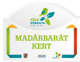
madárbarát kert kerámia tábla

Azon családok, akik a madárvédelmi eszközöket átvették, és legalább egy éve gondozzák a hozzájuk érkező madarakat, „Madárbarát Kert” cím elnyerésére pályázhattak. A 2023. évben 29-en jelentkeztek a „Madárbarát Kert” címmel. A Madárbarát Kert címek átadására a 2023. október 1-jén megrendezett Zöld Családi Nap rendezvény keretein belül került sor.