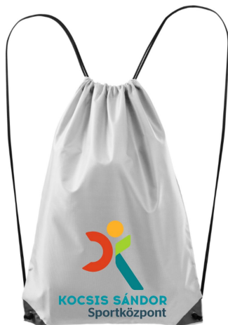
Poly tornazsák felirattal