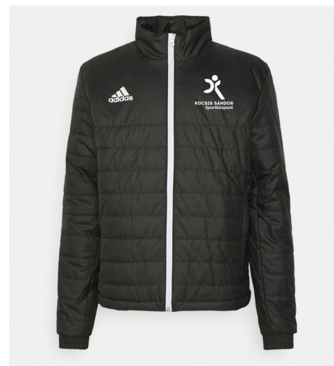
Téli kabát felirattal