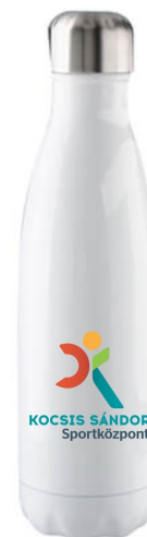
Kulacs fém 650ml