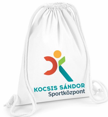
Pamut tornazsák felirattal