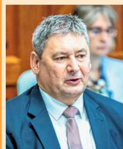
D. Kovács Róbert Antal polgármester