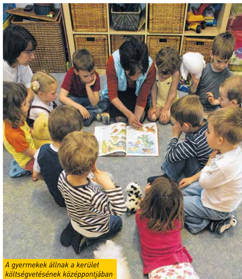
A gyermekek állnak a kerület költségvetésének középpontjában

A közbiztonság, a gyermeket nevelő családok és a rászorulóknak – Kőbánya önkormányzata elsősorban az ő érdekeiket tartotta szem előtt, amikor elfogadta a kerület 2016-os költségvetését. Átalakul az egyébként egyedülálló gyógyászati segédeszközök rendszere: azt már minden, 170 ezer forintos nyugdíjnál kevesebbet kapó idős ember igényelheti, és nem csak segédeszközökre. Idén negyvennel több közterület-felügyelőt foglalkoztatnak és 6,5 millió forintos keretet biztosítanak a lépcsőházi kamerák pályázatára. A gyermekes családok támogatását újabb kedvezményekkel bővítik. Beruházásokra 1,6 milliárdot, intézményfelújításokra 2,9 milliárd forintot költ Kőbánya.