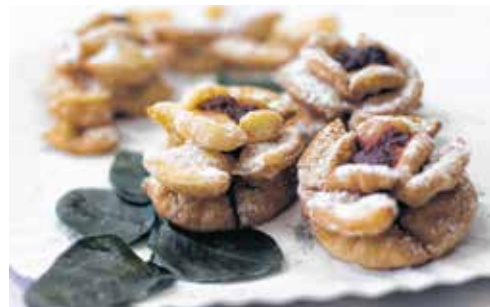
A rózsfánk nem csak ízével, szépségével is lenyűgözte a bírálókat

nyira biztosak voltak a szorgos nagymama győzelmében. „Folyton süt” – kommentálták a sikert. Az idén 82 éves asztrái szinte csak legyintettek egyet, any-