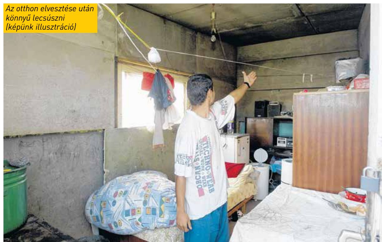
Az otthon elvesztése után könnyű lecsúszni (képünk illusztráció)

nélkül vehető igénybe, cserébe viszont az ellátottaknak nagyon szigorú vállalásokat is kell tenniük; elsőként azt, hogy aktívan együttműködnek a sorsuk megváltoztatásában.