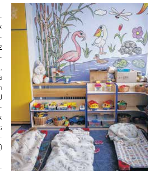
Az óvodai és bölcsődei dolgozóknak 2 százalékos bértöbbletet szavazott meg az önkormányzat tavaly

A Közalkalmazotti Érdekegyeztető Tanács ülésén ismerhették meg az érintettek a kerület idejéit. A megjelentek elégedettek voltak és köszönetet mondtak az önkormányzat intézkedéseiről, az óvodák és bölcsődék azért, hogy 2 százalékos bértöbbletet szavaztak meg nekik, amit jutalomként, illetve többletmunka díjazásáért kaphatnak meg. Az ülésen kiderült: jár az éves szinten nettó 120 ezer forintnyi cafetéria és a továbbképzésükért adandó támogatás. A résztvevők megtehették azt is, hogy az előzetes tervek alapján, kiszámítható módon zajlik az intézmények felújítása, illetve 60 millió forintot különítettek el az intézményi udvarok felújítására. Egyedüli problémaként az óvodai fluktuációt jelezték a megbeszélésen részt vevők, a mintegy 300 fős létszámból idén hatan távoztak, ami ugyan nem tűnik soknak, mégis azt kérték, a kerület dolgozzon ki valamilyen rendszert a dolgozók megtartására. Az alábbi önkormányzati üdülőben idén is kedvezményesen nyaralhatnak a kőbányai köztisztviselők és közalkalmazottak családjukkal, illetve a nyári táborokban felügyelő pedagógusok díjazását is növelni ebben a szezonban a kerület.