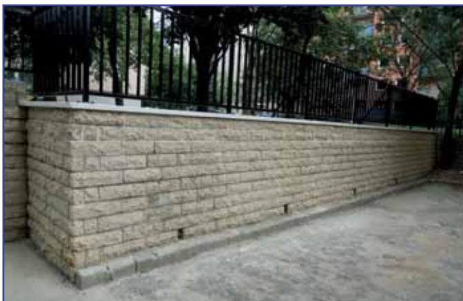
Ilyenek lesznek a felújított támfalak

A Kőbányai Önkormányzat és a Kőbányai Vagyonkezelő Zrt. kéri a lakosság szíves türelmét és megértését!