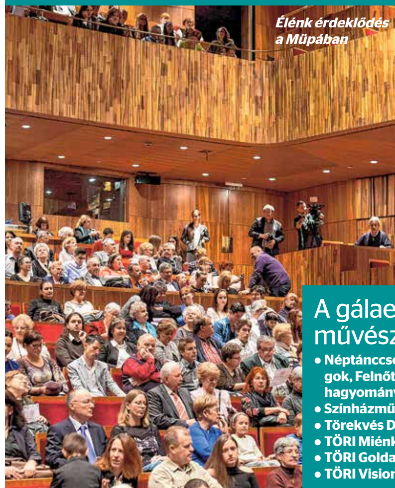
Élénk érdeklődés a Műpában

Nagyszabású gálaesttel ünnepelte fennállása 130. évfordulóját a Törekvés Művelődési Központ, az ország egyik legrégebben működő művelődési intézménye.