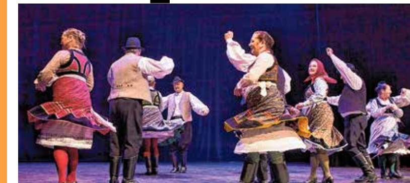
A Cavinton megosztott első helyezést ért el