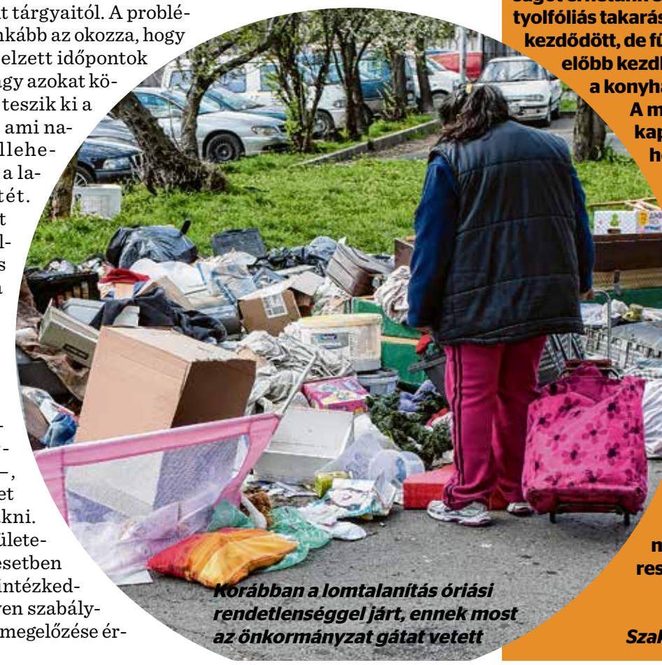
Korábban a lomtalanítás óriási rendtelenséggel járt, ennek most az önkormányzat gátat vetett

A fentiekben túl szintén sok bosszúságot okoznak a lomok között keresgélő „lomosok”. Ők óriási rendtelenséget hagynak maguk után, de gyakori, hogy a közterület egyes részei napokra „birtokba veszik” – törvénytelenül. Számos hasonló esetben is intézkedni kellett. Előfordult, hogy az ország távolabbi szegleteiből érkezett lomokkal szemben léptek fel a közreműködők, illetve intézkedtek olyan esetekben is, amikor a lomok elszállítására hozott utánfutók szabálytalanul parkoltak. Ilyenkor a járművekre kerékbilincs került.